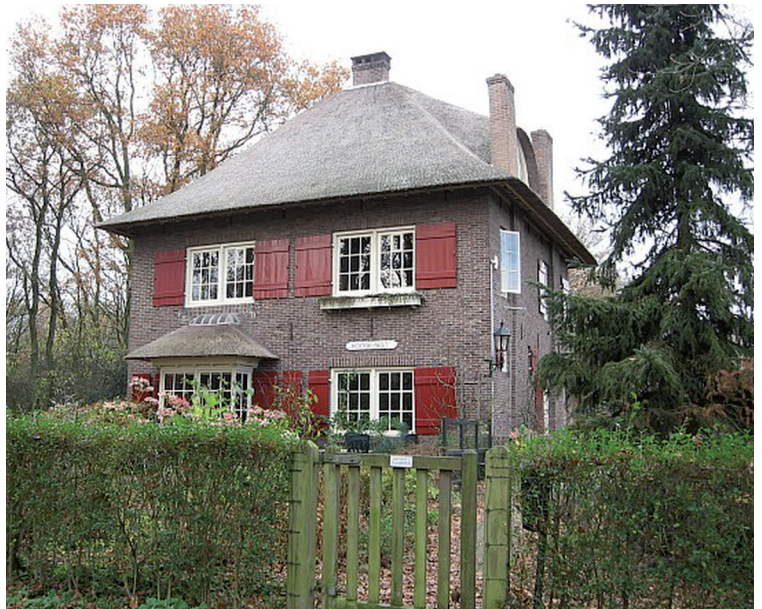
Villa 't Hooge Nest