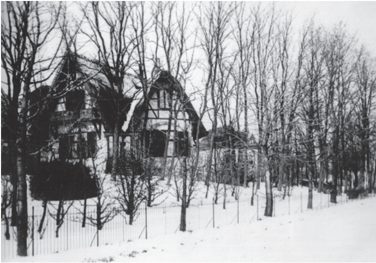
Villa Solitude, Gooilandseweg 1

te hanteren was. Voortaan stond in advertenties voor dienstmeisjes altijd dat het kunnen omgaan met een ezel een voorwaarde was.