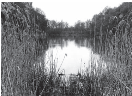
In 1975 tekent het cement van het zwembad zich nog af in het zand