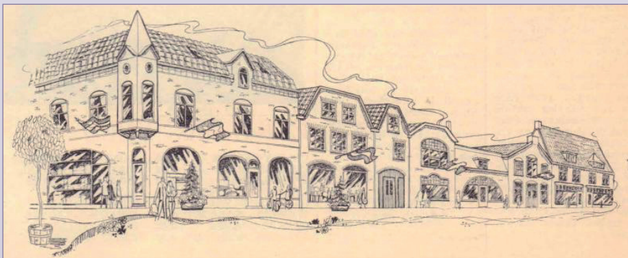
Het culinair imperium van Hosman aan de Nassaustraat