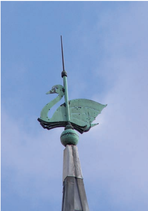
De zwaan, luthers symbool, op de torenspits van de Lutherse kerk aan de Mecklenburglaan

en in 1903 bouwden ze een kerk aan de Mecklenburglaan 50, waar ze tot op heden nog steeds gebruik van maken.