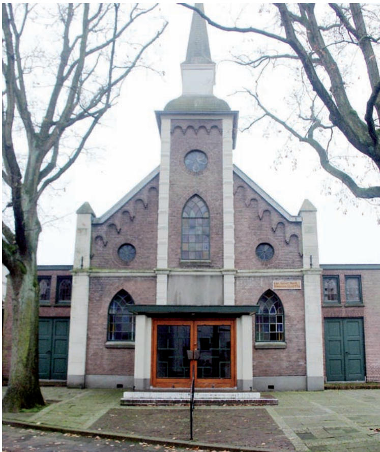
Het (christelijk) gereformeerde kerkje aan Iepenlaan 6 in 2006

tot enige tienduizenden. De meeste nieuwe inwoners kwamen van elders, waren vaak protestants en over het algemeen goed opgeleid, liberaal en ook welgesteld. In diezelfde tijd ontstonden er landelijk in de Nederlandsch Hervormde Kerk stromingen ('richtingen') die zich gaandeweg profileerden. Zo was er een vrijzinnige 6 richting, een orthodoxe, en een confessionele richting 7 , en een rechtzinnige, bevindelijke groep die dicht bij de gereformeerde stromingen stond. En er was een brede middengroep.