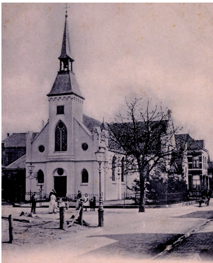
De hervormde kerk in 1903

De Doleantie 4 in 1884 was een kerk-scheuring. Het was vooral een reactie op het vrijzinniger wordende klimaat in de Nederlandsch Hervormde Kerk. Journalist, theoloog, predikant, later staatsman Abraham Kuyper was de charismatische voorman. Na een conflict met de Hervormde Kerk riep hij kerkleden op om plaatselijk de reformatie weer ter hand te nemen en de reglementenkerk, zoals hij de Nederlandsch Hervormde Kerk noemde, te verlaten. Ook in Bussum vond deze oproep gehoor. In 1887 scheidde zich een aantal gezinnen af; zij stichtten de Gereformeerde Kerk 5 van