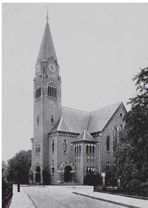
De Vredekerk aan de Huizerweg hoek Nieuwstraat

Tussen 1880 en 1920 gebeurde er heel veel in Bussum. Bussum groeide in die periode zeer sterk, van enige duizenden inwoners