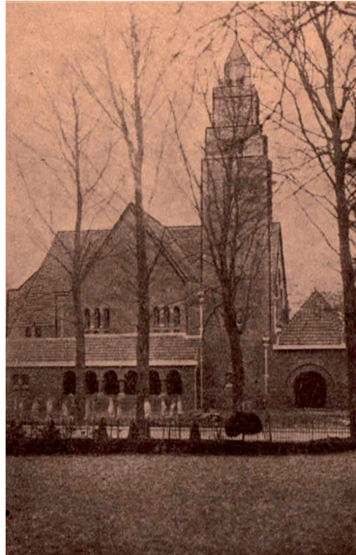
De Spiegelkerk, gebouwd door de Vereniging tot Evangelisatie

Halverwege de 19de eeuw ontstonden in een aantal plaatsen Vrije Evangelische Gemeenten. Het waren rechtzinnigen uit de Nederlandsch Hervormde Kerk, die vrij en zelfstandige wilden zijn. Later vormden ze een bond. Nieuwe Bussumers die elders