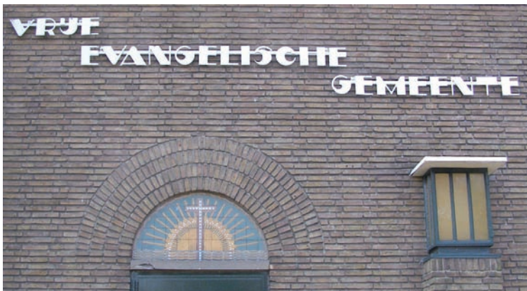
Linkerzijde van de kerk van de Vrije Evangelische Gemeente met tegeltableau uit de tijd dat het de Apostolische kerk was