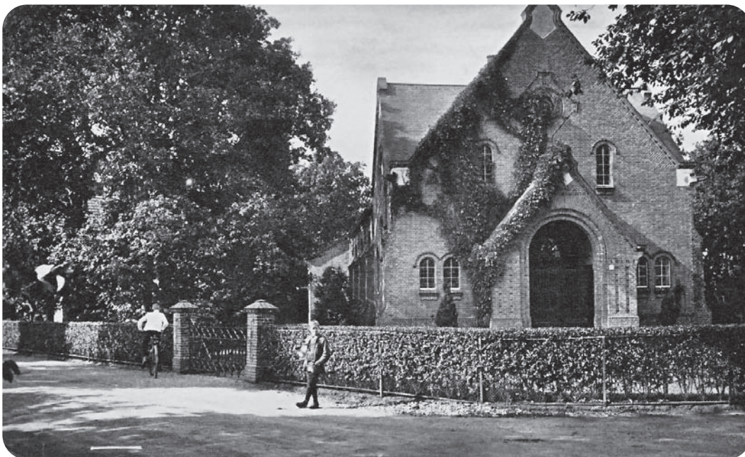
De kerk van de Nederlandsche Protestantenvbond, nu de Majellakapel, in 1932