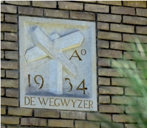
Gevelsteen De Wegwijzer, Koningslaan 54A

‘Een iegelijk die wel eens tochten heeft gemaakt in de automobiel kent den naam Sleeswijk. De kaarten van dezen Bussumschen uitgever worden alom geapprecieerd.’ Ook het verenigingsblad van de Bussumse voetbalvereniging