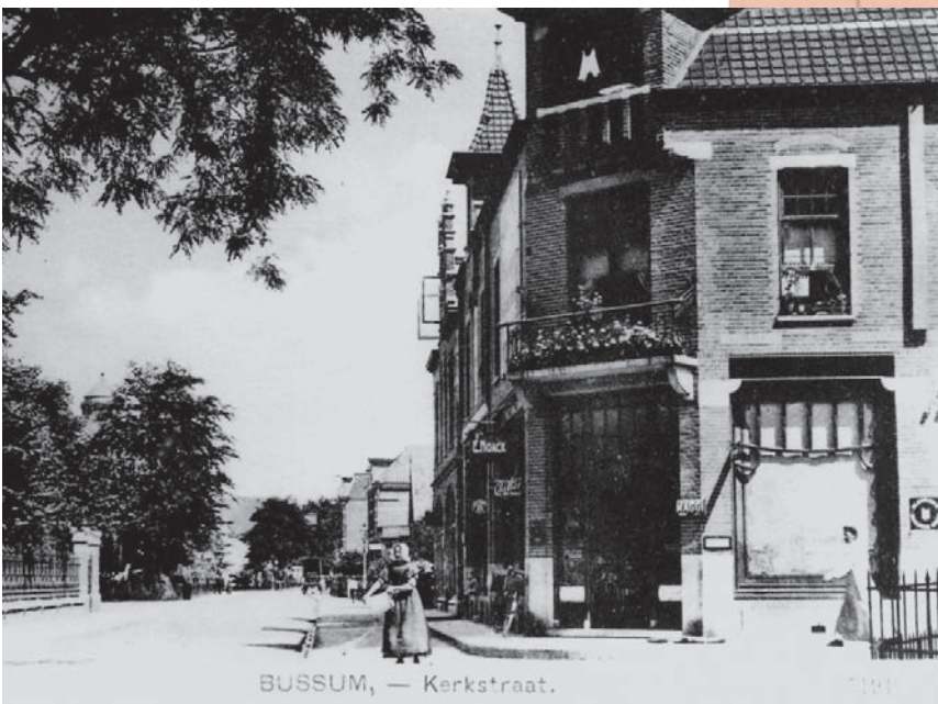
De winkel van Noack aan Kerklaan 2, hoek Brinklaan

provinciekaarten en atlassen over van J.A. Sleeswijk. Uitgeverij Kompas noemde in reclames de kaarten geschikt ‘voor school, kantoor en de huiskamer’. De Kompas-kaarten zijn uitgegeven tot de jaren zeventig van de vorige eeuw.