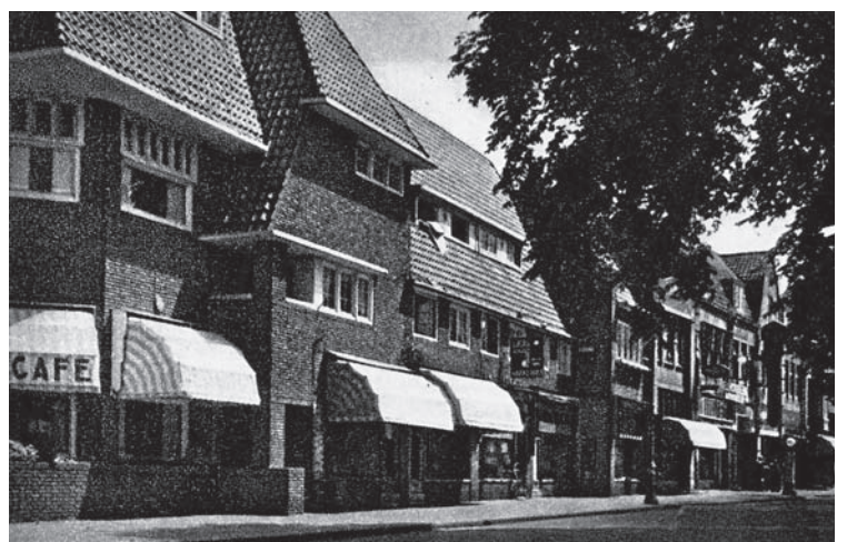
Het hotel en de vijf winkels aan Vlietlaan. De winkel met het tweede zonnescherm van rechts is de Bussumsche Boekhandel en rechts ernaast is de benzinepomp van autobedrijf Hogguer zichtbaar