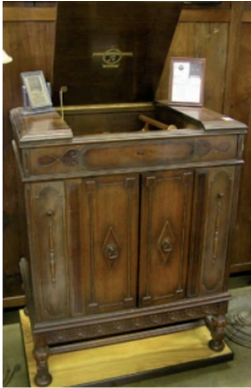
Een Columbia-Holster platenspeler

showroom – waarvan de wanden zijn bekleed met wit marmer – ernaast twee kantoren en daaraan grenst aan de andere zijde de rijwielpaarplaats van 14 x 22 M., plaats biedend aan niet minder dan 800 rijwielen. Ook hieraan is een ruime reparatie-inrichting verbonden. Zoowel auto- als rijwieltalling zijn opgetrokken van gewapend beton en dus volkomen brandvrij.