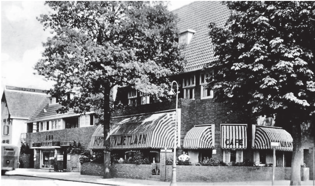
Het hotel aan de zijde van de Generaal de la Reijlaan, links de auto- en rijwielstalling van het bedrijf ARO

-herstelinrichting gaan gebruiken. In april 1928 vroeg Wilke in een advertentie een prijsopgaaf voor het amoveren (afbreken en verwijderen) van het oude hotel. De firma Gebr. De Boer Jbz uit Oostzaan verkreeg de klus. Nadat de afbraak voltooid was, begon de bouw in oktober 1928. De uitvoerder was M.J. Mouw.