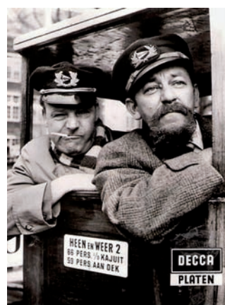
De Wama's in 1963