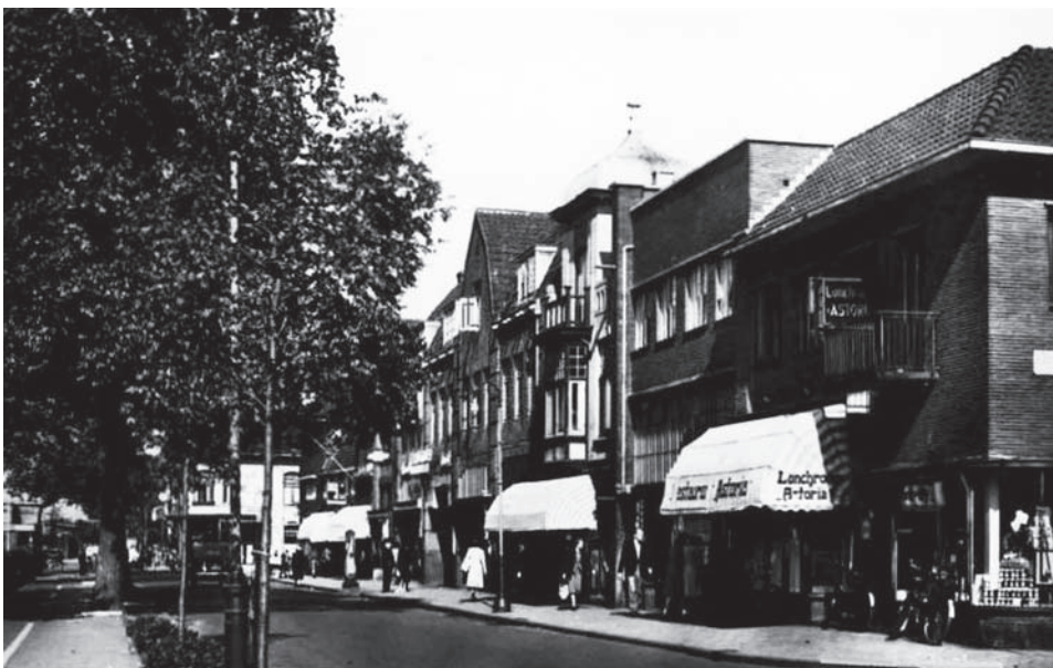
Lunchroom Astoria op de hoek van de Vlietlaan en de Nieuwe Englaan

In het ruime sous-terrain onder het hotel zijn de kelders voor provisie, bier en andere dranken en kolen, terwijl wij er ook de centrale verwarming zien, welke door het geheele gebouw en ook door beide stallingen warmte zal verspreiden.'