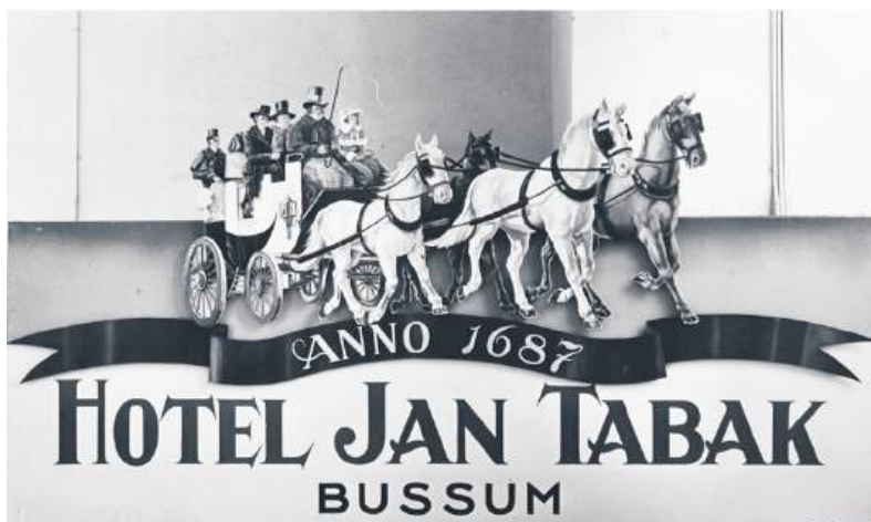
■ Een geïdealiseerde weergave van de postkoets van Naarden naar Osnabrück, die ook Jan Tabak aandeed.