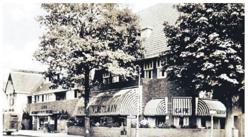
■ Hotel Vlietlaan, zijde Generaal de la Reijlaan, kort na de opening in 1929.