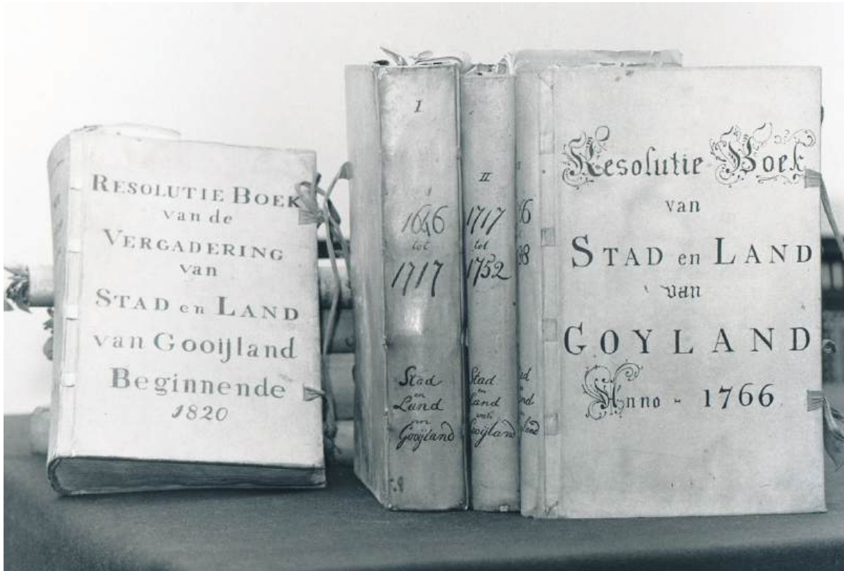
■ Resolutieboeken (besluiten) van Stad en Lande van Goylant, de organisatie van de erfgooiers.

Naarden had door middel van een kanaal een verbinding met de Zuyderzee. Via de vestinggracht en het Naardermeer kon men over water ook de Vecht bereiken. Pas in de zeventiende eeuw, in 1641, kwam er een trekvaart tussen Naarden en Muiden-Amsterdam. Naast de trekvaart met zijn jaagpad werd een zandpad aangelegd voor het wegvervoer, in feite de verre voorloper van de A1. Daarna duurde het tot het einde van de achttiende eeuw voor er weer kanalen werden gegraven in het Gooi. De Bussumervaart dateert uit die periode, maar was in feite