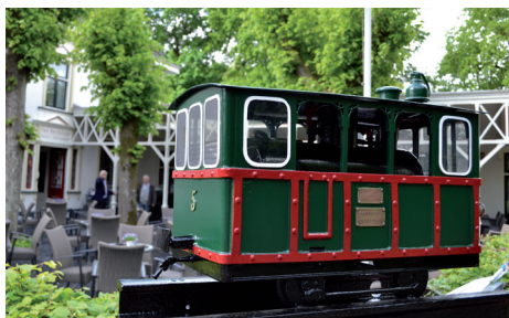
Gooise Trammonument te Muiderberg.

Niet-leden kunnen ook mee, maar betalen een bijdrage van € 5 per persoon. Later dit jaar zullen er nog meer tochten georganiseerd worden. Bij voldoende belangstelling ook vanuit Naarden en Muiden. Houdt daarvoor de plaatselijke en regionale bladen in de gaten.