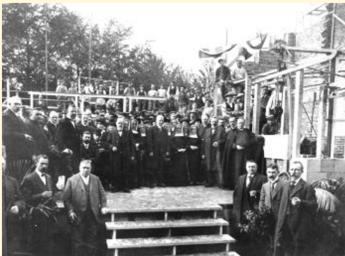
Plaatsing van de eerste steen van het Majella-ziekenhuis in 1915

Op 16 oktober 1915 werd de eerste steen gelegd voor het Gerardus Majella Ziekenhuis, dat in later jaren zou uitgroeien tot een gigantisch complex. Toen het ziekenhuis in 1990 werd afgebroken verdween die steen naar de opslag van de Historische Kring Bussum. Maar wie wat bewaart, die heeft wat: op 17 mei wordt de steen teruggebracht naar zijn oude locatie aan de Iepenlaan, bij de entree van het Majellapark, dat op de plaats van het oude ziekenhuis is verrezen.