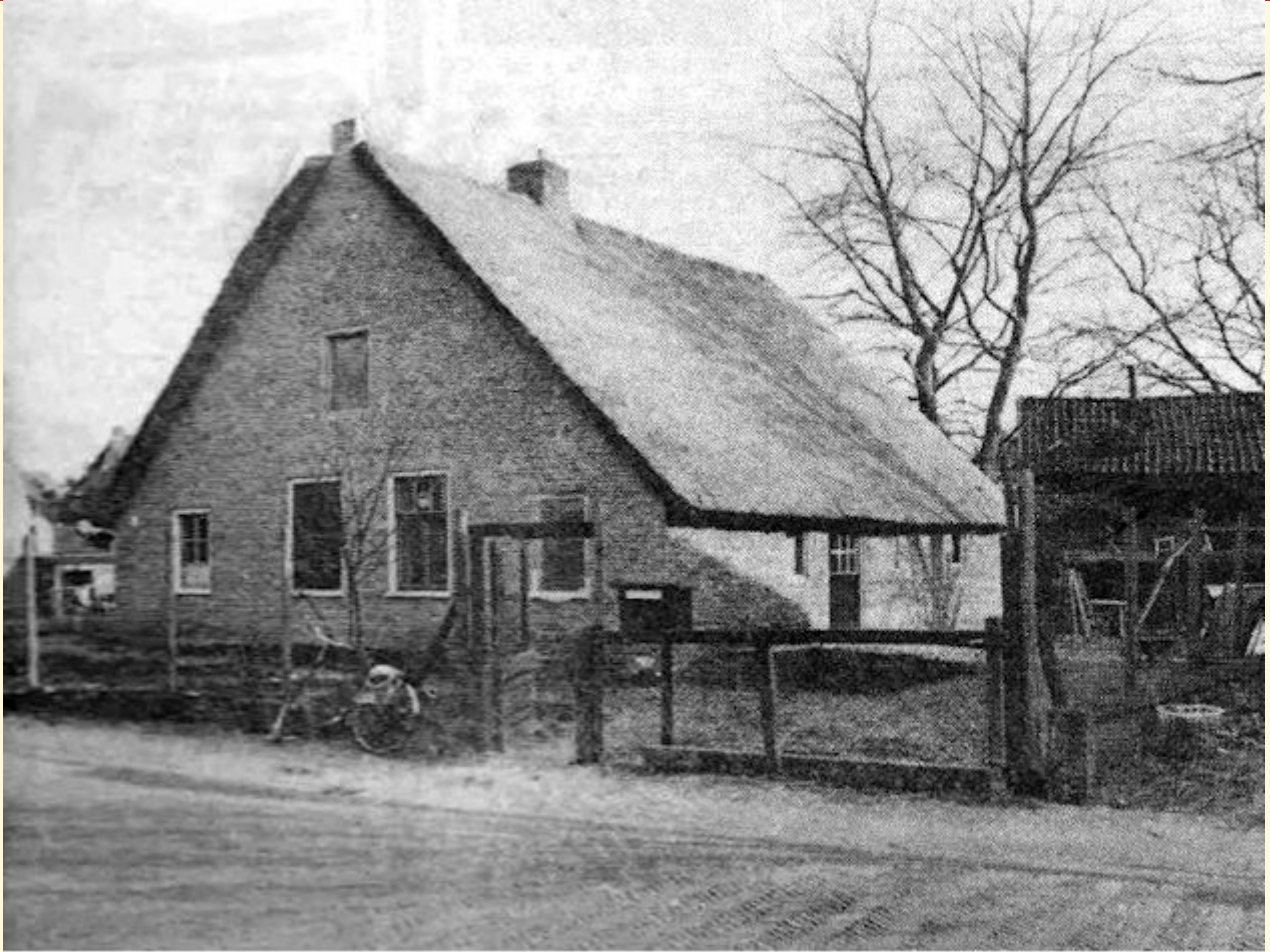
Plaggenweg 5, voor de sloop