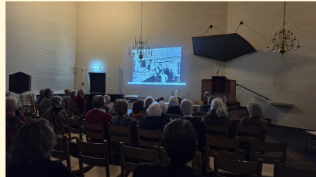
Vertoning van de film over het 'Veffershuis' tijdens de jaarvergadering