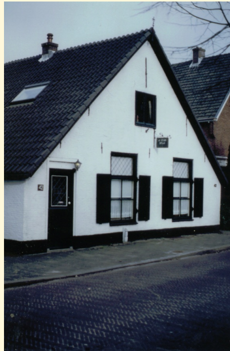
Boerderij De Witte Hoeve aan Herenstraat 44

Starttijd: 13.00 uur, deelname gratis. Wel aanmelden d.m.v. het formulier Aanmelding Wandelexcursies . Hier vindt u ook de overige excursies die de HKB dit jaar organiseert, onder andere op zondag 10 mei (Winkelcentrum Bussum)