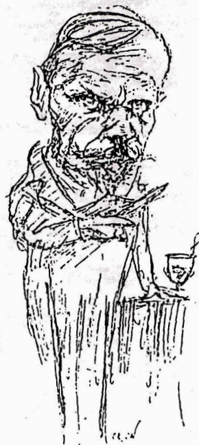
Dit is Frederik van Eeden. Die vaak — en niet zonder reden! — Om zijn eigenaardigheden, Fel en vinnig werd bestreden. Maar dien men toch graag erkent Als een man van groot talent.