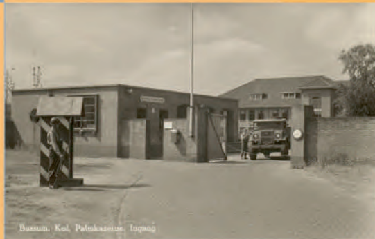
Bussum, Kol. Palmkazerne, 1900-05