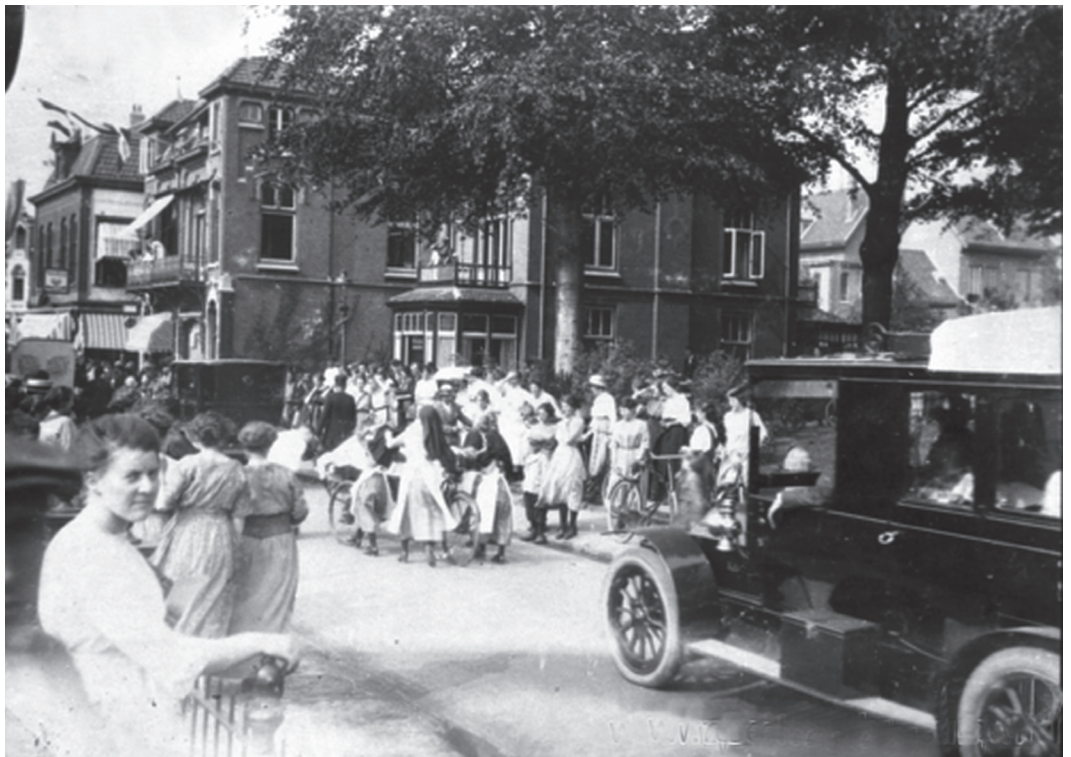
Optocht door de Brinklaan, rechts de eerste ziekenauto van de Majellastichting

meester kinderzang voor het gemeentehuis, 's middags een optocht waarin tal van verenigingen acte de presence gaven en die uitmondde in een bloemenhulde aan koningin Wilhelmina. Daarna was er zowel