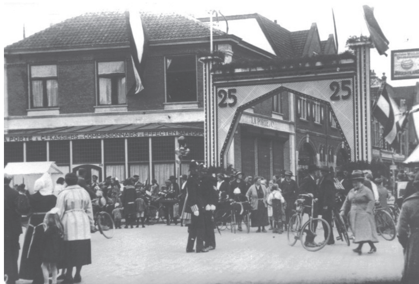
Erepoort bij de Nassaulaan

Het vijftienvijftigjarig regeringsjubileum in 1923 was in heel Nederland aanleiding voor groots opgezette feesten. Ook Bussum pakte uit met een feestprogramma van drie dagen dat klonk als een klok.