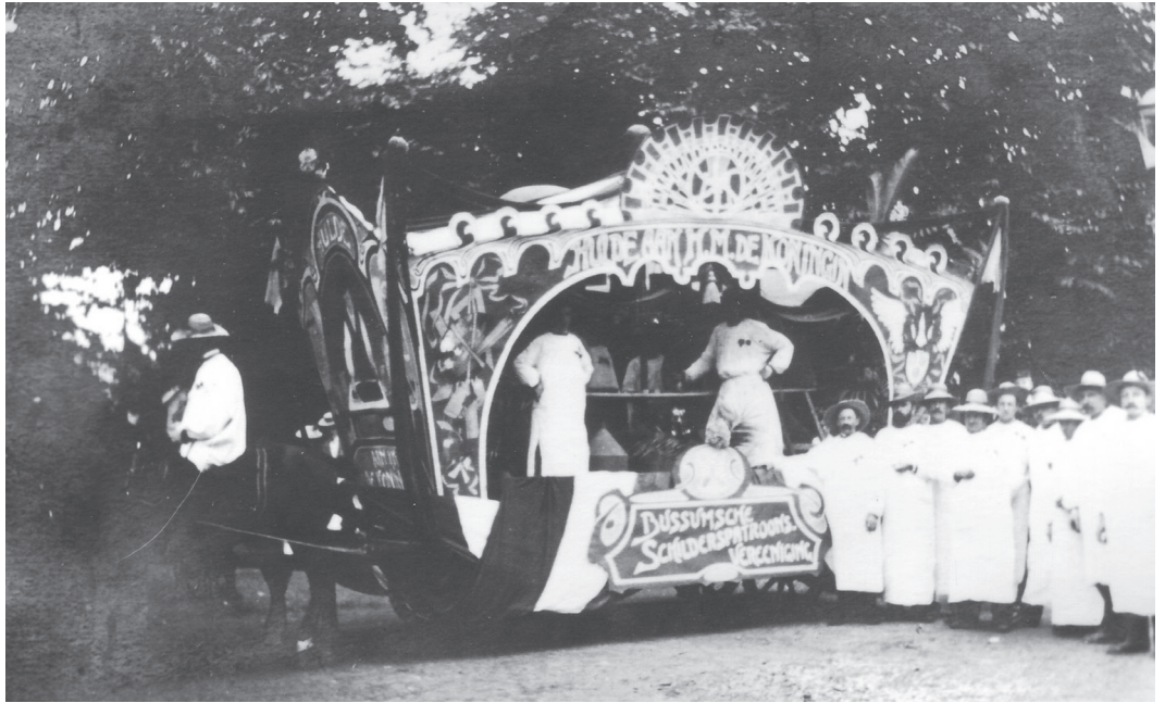
De praalwagen van de Bussumse Schilder- patroonsvereniging