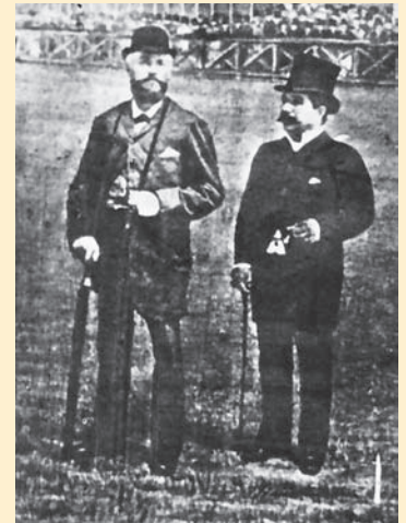
Pieter Langerhuizen (met hoge hoed), hier tezamen met koning Willem III

de architect W.J. Hamdorff het landhuis en in 1929 werd de tuin opnieuw aangelegd. Momenteel bestaat (een deel van) het landgoed Crailo nog als buurtschap in Huizen en als natuurgebied van het Goois Natuureservaat.