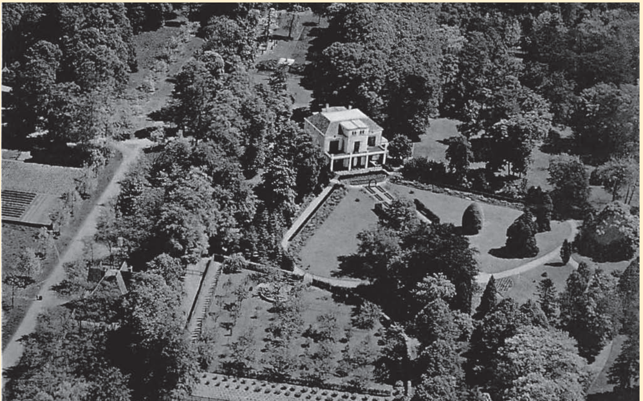
Villa Oud-Crailo (luchtfoto KLM, 1935)

A.P. Kooyman-van Rossum en D.F. Winnen, 'Crailo, geschiedenis van een landgoed (deel 1)', in: Tussen Vecht en Eem , jrg. 4, nr. 3 (1986) blz. 155-175 'Rijksmonument Oud-Crailo, Huizen' op Monumenten.nl.