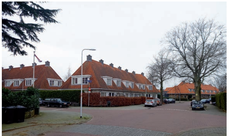
Arbeiderswoningen aan de K.P.C. de Bazelstraat

De Bazel hield in zijn ontwerp rondom bijvoorbeeld het Zaandammerplein (1919) en het Van Beuningenplein (1914-1918) in Amsterdam West met gesloten bouwblokken met terugliggende hoeken, rekening met de stedelijke bebouwing. Zijn ontwerp in dezelfde periode van de Godelindebuurt