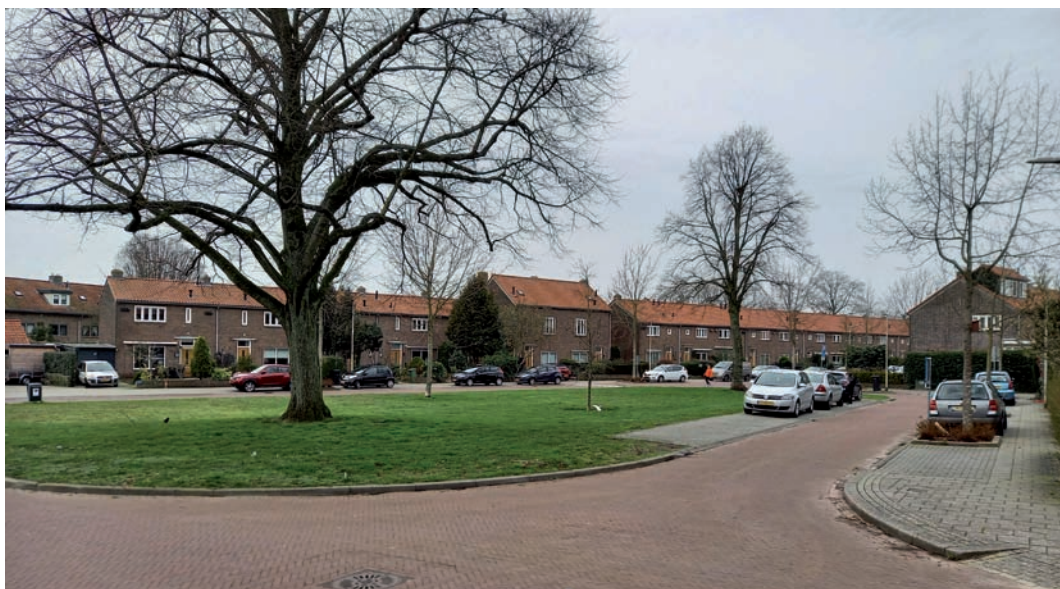
T.B. Huurmanlaan bij de Jan Bottemastraat