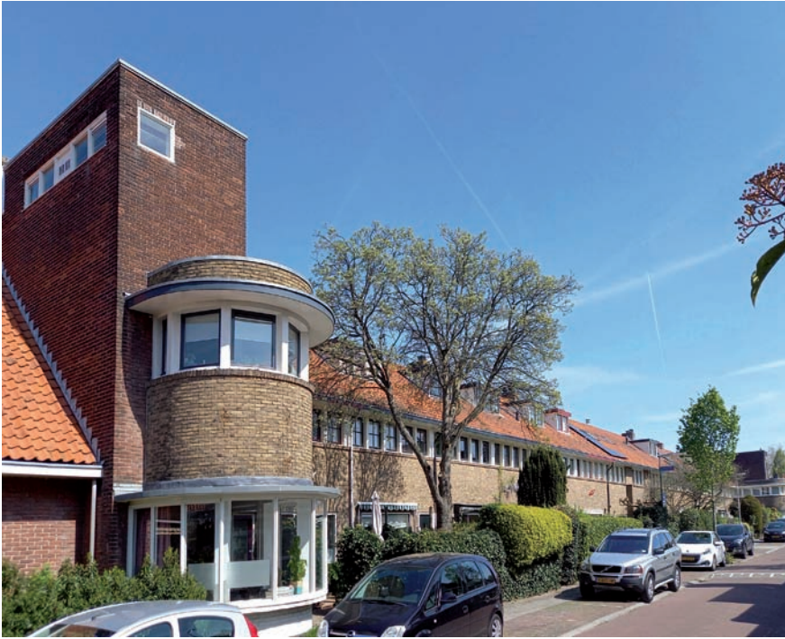
Middenstandswoningen aan de Korte Godelindestraat