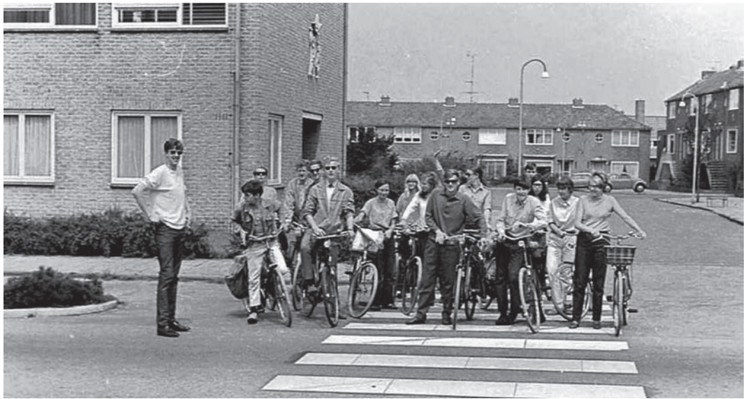
Op de fiets naar Nijkerk