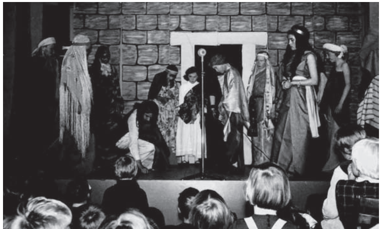
jaren '60 en '70', in: Bussums Historisch Tijdschrift , nr. 1 (2010)