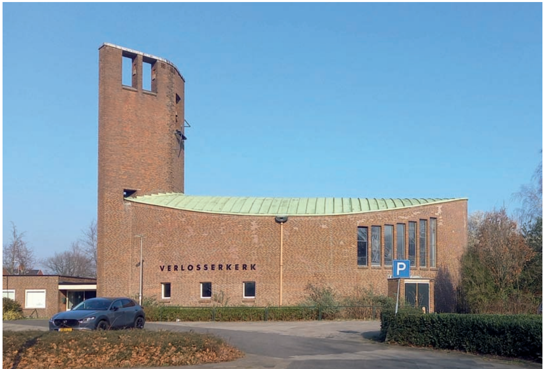
De westelijke gevel

In Bussum-Zuid stonden sinds de jaren vijftig van de vorige eeuw drie kerken. Dat waren de rooms-katholieke St.-Jozefkerk aan de Laarderweg, de gereformeerde Zuiderkerk aan de Ceintuurbaan en de hervormde Verlosserkerk op de hoek van de Lorentzweg en de Ceintuurbaan. Door de ontkerkelijking werden op den duur al deze kerken overbodig. De Zuiderkerk is in 2003 gesloopt om plaats te maken voor een appartementengebouw. De St.-Jozefkerk werd in 2018 overgenomen door de Koptische Kerk en heet tegenwoordig Heilige Maria en Sint Verina Kerk. De Verlosserkerk was nog tot en met 2019 in gebruik en krijgt nu een andere bestemming. Hieronder volgt de geschiedenis.