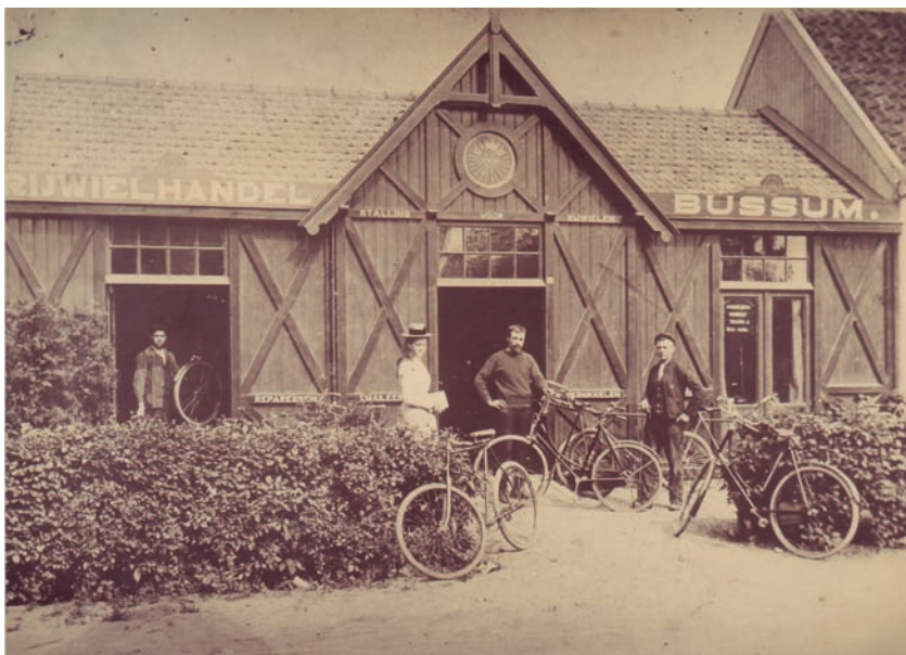
De rijwielstalling van Mols in 1910

Eveneens in het voorjaar van 1903 riep Exploitatie-Maatschappij Oud Bussem een zomerdienstregeling in het leven met een autobus, destijds omschreven als 'motoromnibus'. De bus reed dagelijks tien keer op gezette tijden op en neer tussen Hotel Jan Tabak en station Naarden-Bussum, met een tussenstop op de Huizerweg nabij De Gooische Boer. De start van de busonderneming in het pinksterweekend van 1903 was een deceptie, want de meeste keren kreeg de chauffeur de bus niet aan de praat. Toen dit euvel verholpen was,