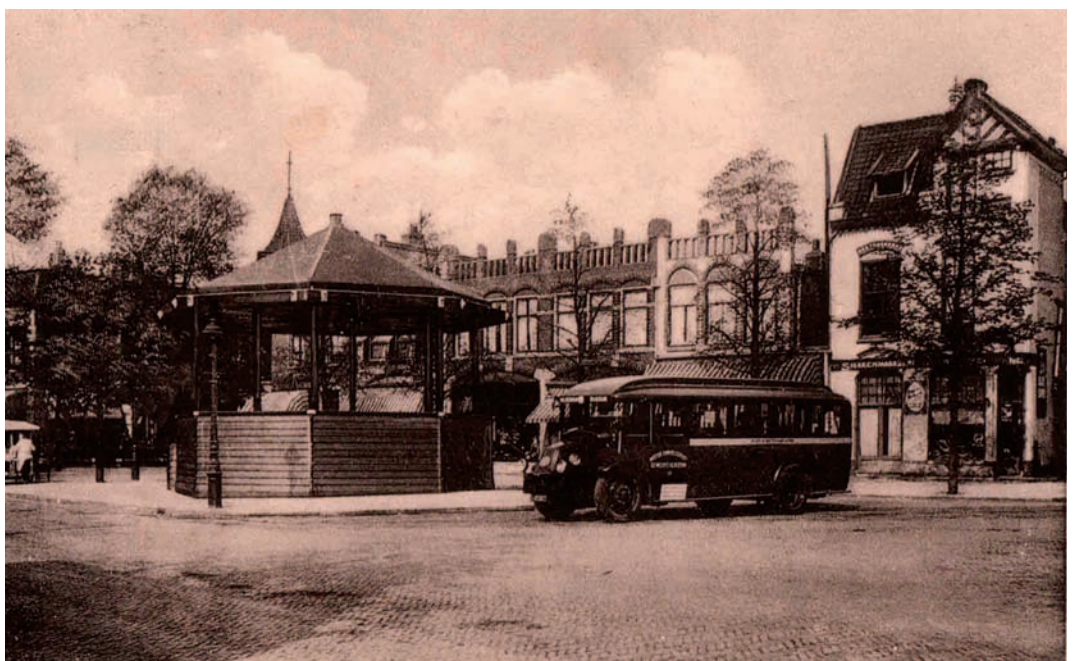
Een autobus van de N.V. Motoromnibusdienst Gemeente Hilversum op de Brink

Diverse kranten uit de periode 1874-1934 Paul Schneiders, Het Spiegel, geschiedenis van een villawijk (1874-heden) . Laren, 2010 (blz. 8 en 9)