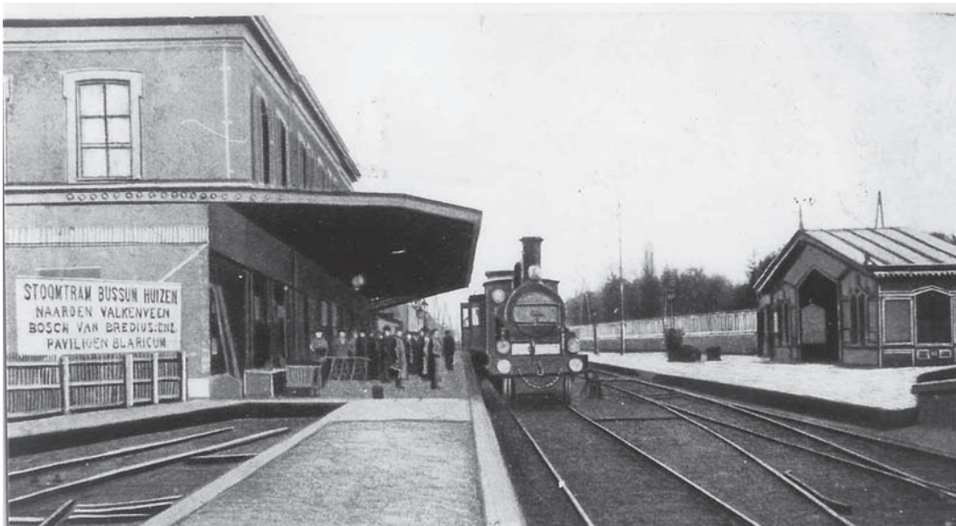
Het perron voor de stoomtram in station Naarden-Bussum

om de inzet van tien extra treinen in de winter. De HIJSM vroeg de forensen een garantie van 400 gulden voor de inzet van die treinen. De 58 forensen (22 uit Bussum, 18 uit Hilversum en 18 uit Weesp) ondertekenden het contract met deze voorwaarde. In 1879 bleek dat de opbrengst van de treinen f 349,42 was. Het tekort van f 50,58 plus f 36,42 onkosten werden door de forensen voldaan, hetgeen voor ieder van hen f 1,50 betekende. Het jaar erna werd de proef herhaald, waarna de HIJSM de treinen definitief aan de winterdienstregeling toevoegde.