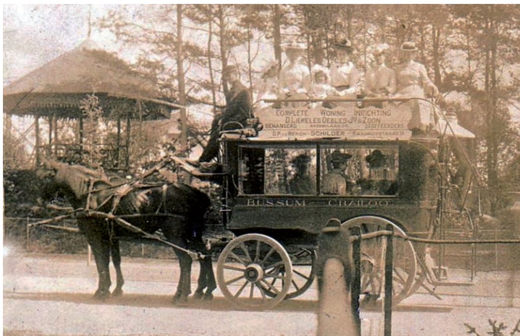
De omnibus bij Crailoo. Let op de zitplaatsen op het dak