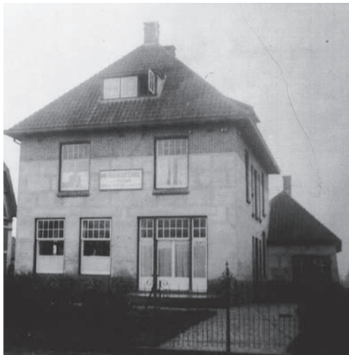
De Huishoudschool aan Huizerweg 30 (later 54)

De klassen 1 en 2 hadden vrij. Op 8 april 1914 richtten de aanwezigen van een over dit onderwerp bijeengeroepen vergadering van de afdeling Bussum van de Nederlandse Vereniging voor Huisvrouwen 'in principie' een vakschool voor meisjes op. Dit zou de Huishoudschool worden, die pas in 1921 geopend werd en die tot 1976 als zodanig heeft bestaan.