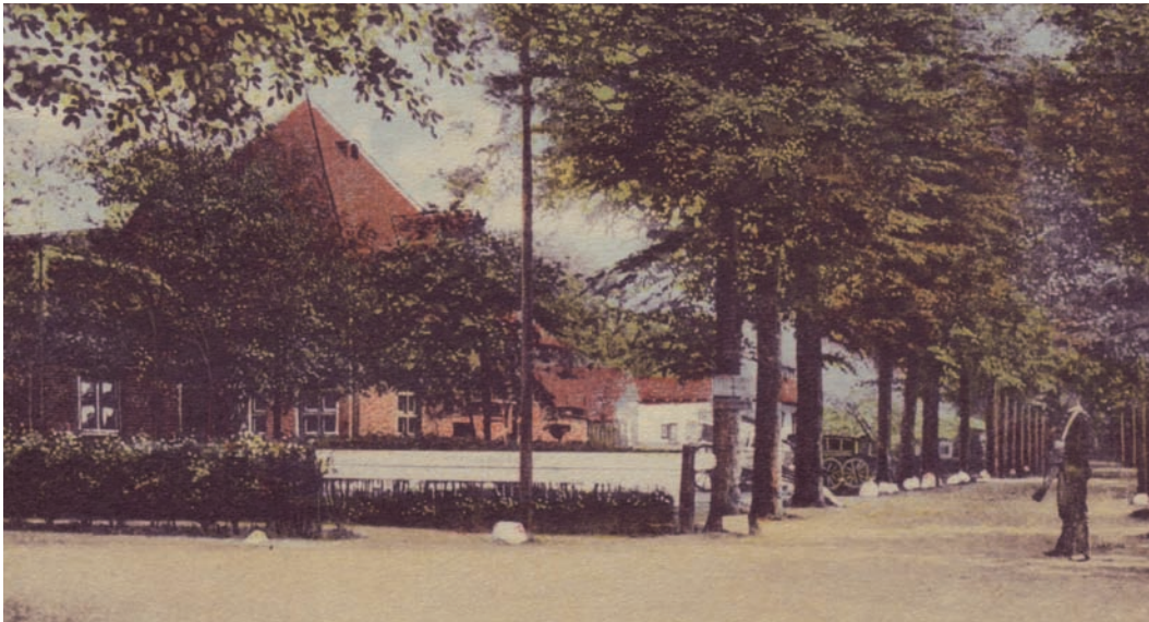
Modelboerderij Oud-Bussem

Te elfder ure werd een koper voor het hotel gevonden in de persoon van de 42-jarige E.H. Oosterwijk uit Den Haag. Oosterwijk betrok met zijn gezin de bij het hotel behorende woning Vlietlaan 26, die Johannes Koderitsch eerder ook gebruikte. Hotel