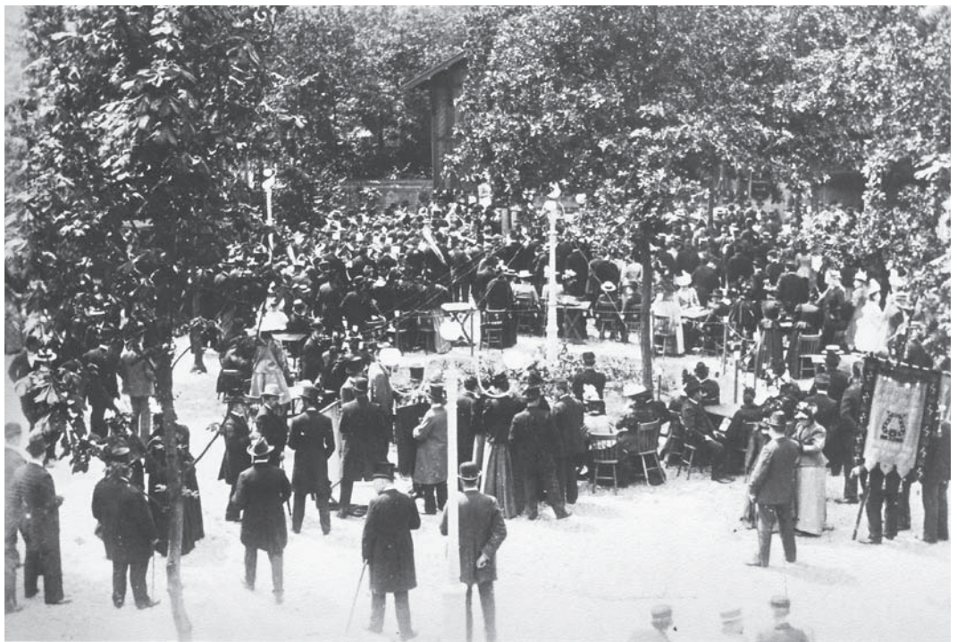
Een muziekuitvoering in de tuin van Hotel Vlietlaan