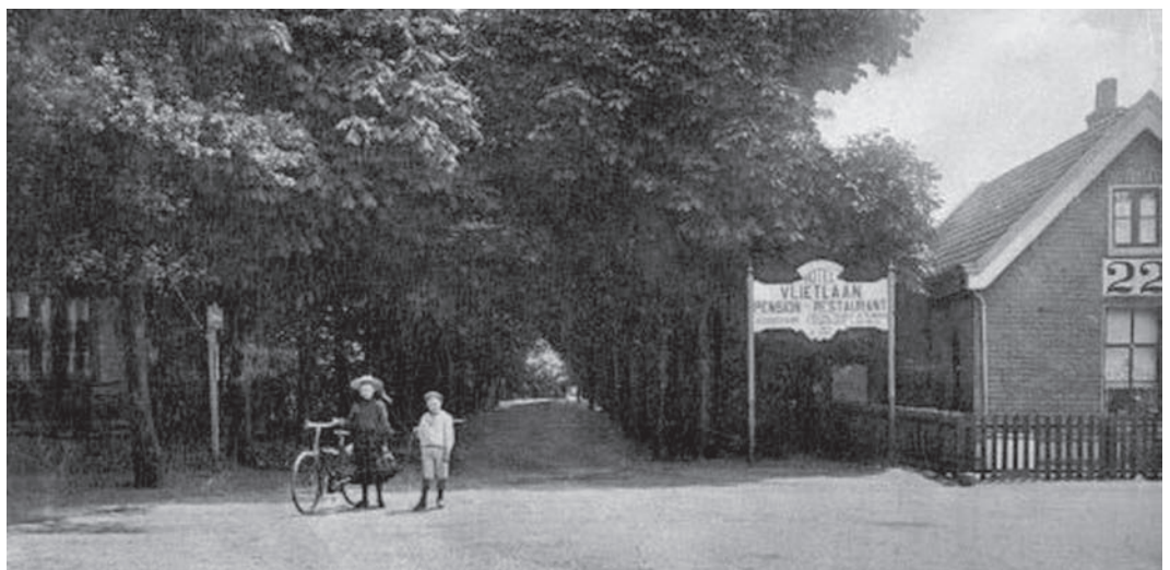
Voor het hotel liet Piet Loman wachthuisje 22 plaatsen voor de overwegwachter. Hij wilde dat zijn Hotel Nieuw Bussum zichtbaar was vanuit de trein, en zijn concurrent Hotel Vlietlaan niet

In de zomer van 1897 vond de Nationale Tentoonstelling van Bloemen en Planten plaats in de zalen en tuinen van Hotel Vlietlaan en Hotel Nieuw Bussum. De tentoonstelling werd bezocht door alle