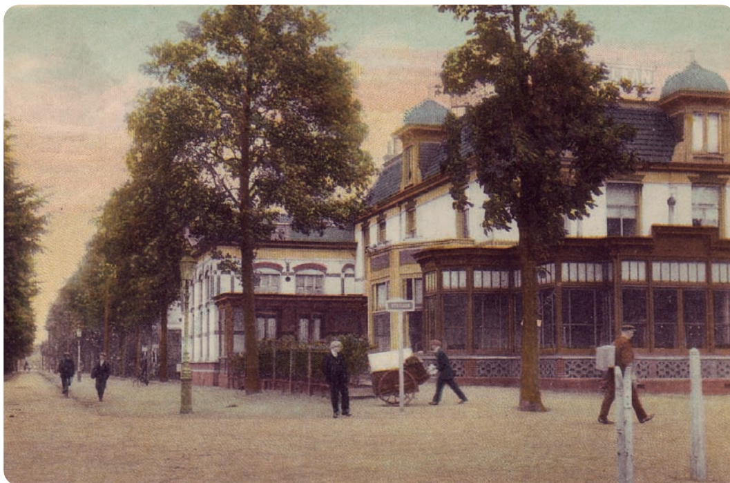
Hotel Vlietlaan omstreeks 1900