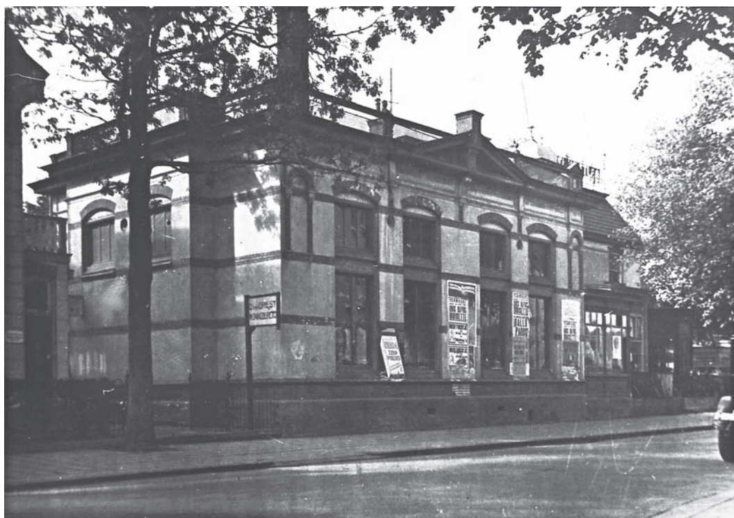
De troosteloze aanblik vanaf de Generaal de la Reijlaan

Het tweede deel over Hotel Vlietlaan komt in het volgende nummer van dit tijdschrift.