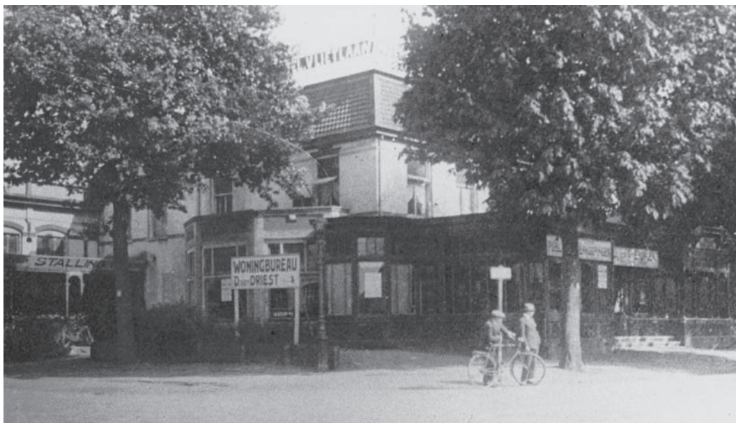
Het voormalige hotel omstreeks 1925