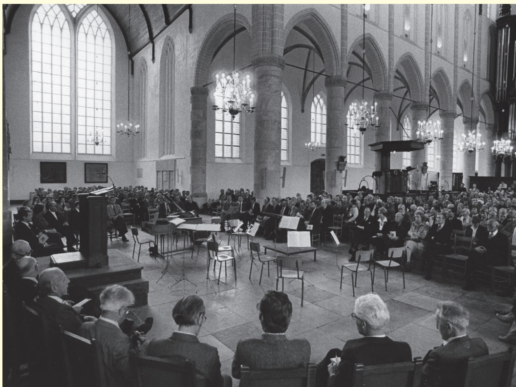
De opheffingsvergadering in de Grote Kerk van Naarden op 28 april 1979

Ach Lieve tijd. Duizend jaar het Gooi, de Gooiers en hun rijke historie , aflevering 5 over de erfgooiers. Zwolle, 1992