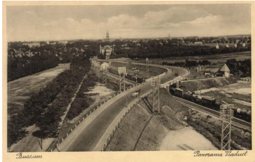
Figuur 3 Viaduct net na de aanleg, 1929

Links in de richting van Hilversum de Watertoren uit 1898. Tegenover de Watertoren de Fransche Kampheide waar tot 1934 een woonwagenkamp was.