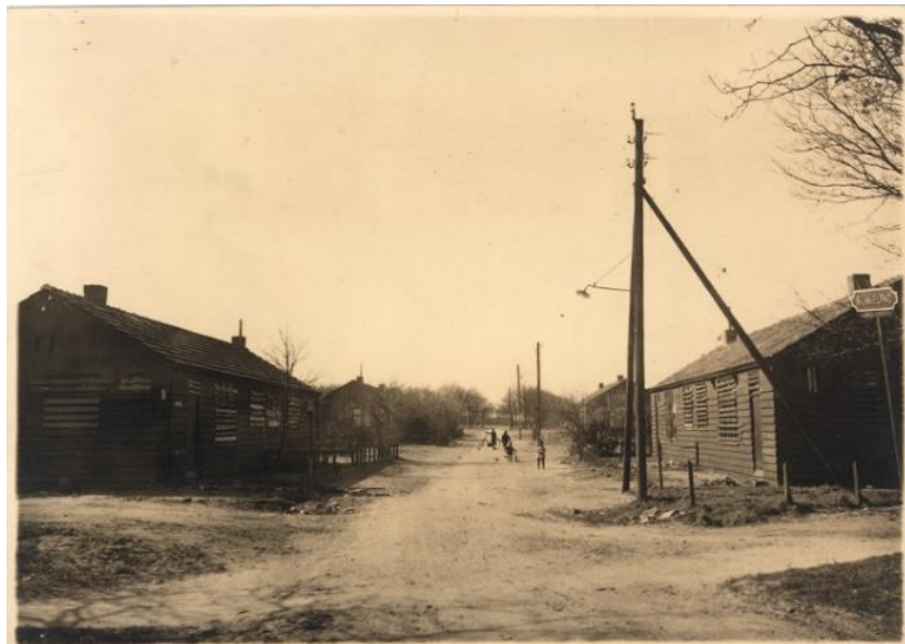
Figuur 14 De houten huisjes van de Kaap, 1932

een bedenkelijke reputatie aan over. De 29 huisjes zaten vol vlooien en werden in brand gestoken.