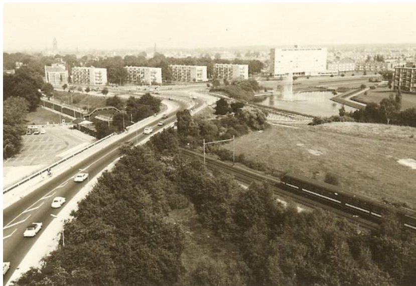
Figuur 4 Viaduct in 1968

Links in de richting van Hilversum de Watertoren uit 1898. Tegenover de Watertoren de Fransche Kampheide waar tot 1934 een woonwagenkamp was.