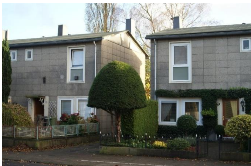
Figuur 12 Aireywoningen aan de Bottemastraat

Links passeren we de Geuzenhof, genoemd naar een Bussumse verzetsgroep.