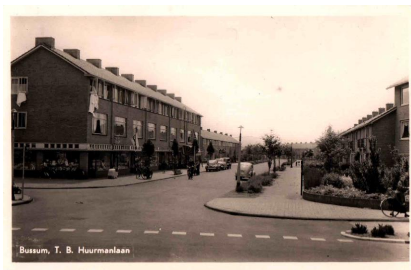
Figuur 10 Begin van de Hurmanlaan

Hier komen we in de Verzetsliedenbuurt, negen straten die tussen 1948 en 1950 zijn aangelegd en die vernoemd zijn naar Bussumse verzetslieden uit de voorbije oorlog.