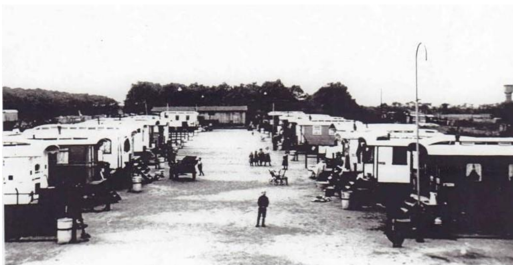
Figuur 15 Woonwagenkamp aan de Laarderweg, 1934

In 1951 werd ook dat kampje (17 wagens) opgeheven en verplaatst naar de huidige locatie aan de Zanderijweg.