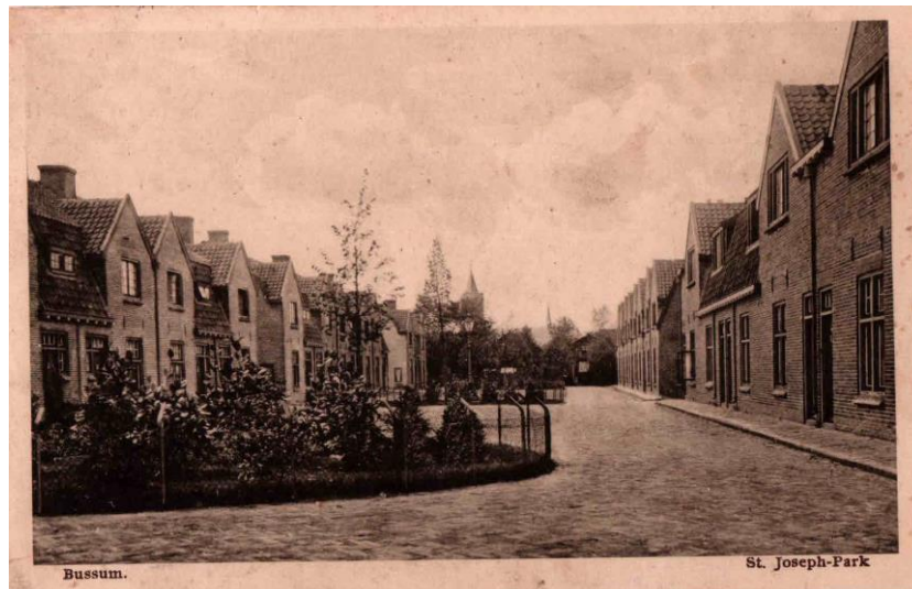
Figuur 7 De peppels

We lopen hier door het St. Jozefpark uit 1914. De huizen hebben een plattegrond van ongeveer 50 m 2 , met een even grote verdieping onder een aflopend dak. Voor toenmalige begrippen waren dit riante arbeidershuizen, waar overigens vaak met grote gezinnen in werd gewoond.