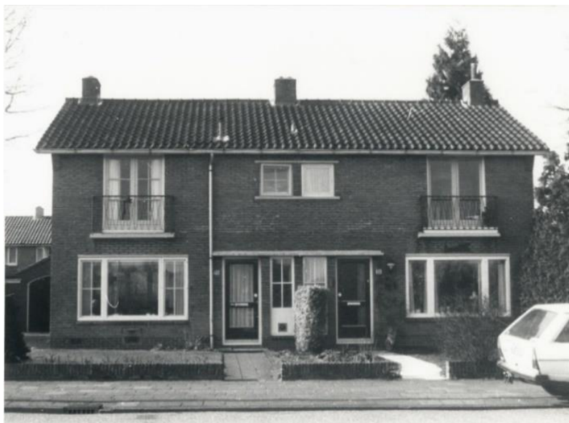
Figuur 11 Boumawoningen aan de De Ruyterlaan

Deze huizen werden goedkoop gebouwd doordat de verdiepingshoogte lager was dan gebruikelijk, wat in totaal 10 lagen baksteen uitspaarde.