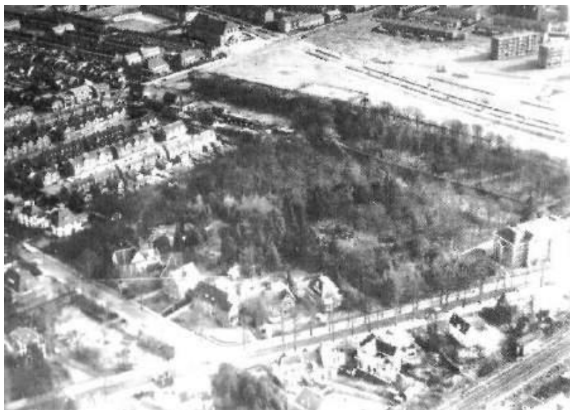
Figuur 5 Bos van Bouvy in de jaren 50

In de loop der tijd zijn er steeds stukken afgeknabbeld ten behoeve van woningbouw. Dat begon al in 1914, toen het St. Jozefpark werd gebouwd. In 1965 volgde de strook lang de Ceintuurbaan, voor de bouw van 4 woningwetflats en het bejaardenhuis St. Antoniushove. Dat laatste is in 1995 gesloopt en vervangen voor het woonwijkje dat er nu ligt. Antoniushof is naar de andere kant van de weg verplaatst.