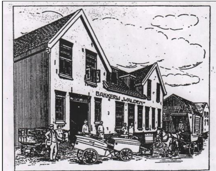
Figuur 8 Bakkerij Walden aan de Hamerstraat