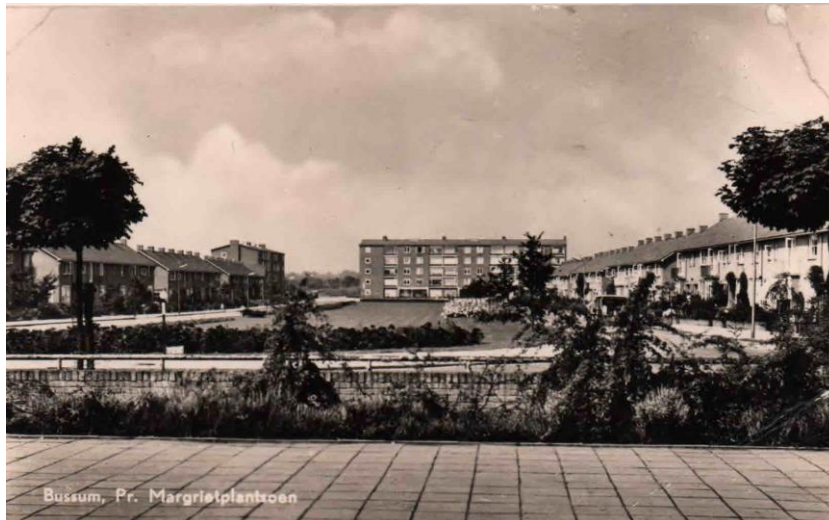
Figuur 13 Prinses Margrietplantsoen

Links op de hoek van Huurmanlaan stond vanaf 1953 de Timotheüschool, een (protestantse) School met den Bijbel. In 1967 werd de school omgedoopt in De Wegwijzer. In 1987 gesloten en afgebroken en vervangen door 2 kleine appartementengebouwen.