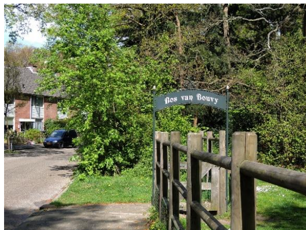
Figuur 6 Speeltuintje Bos van Bouvy