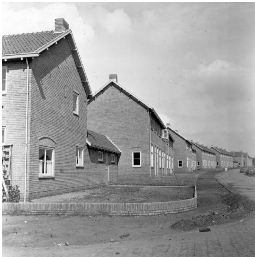
Figuur 16 De Versteeghstraat in 1942 (Engweg)

verzetslieden en een QRcode 1 waarmee u naar onze website gaat om nog meer informatie omtrent deze verzetsmensen te lezen.