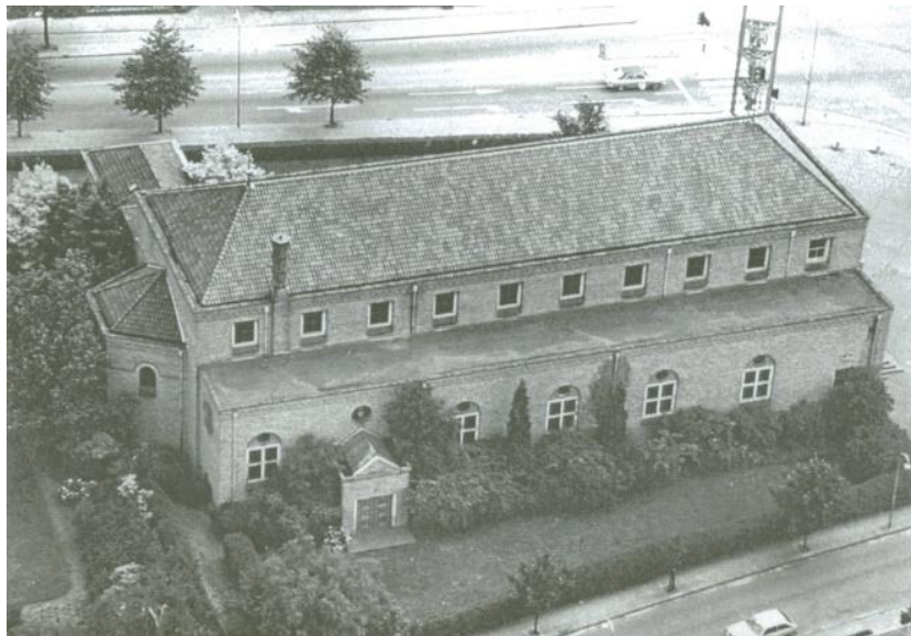
Figuur 9 St. Jozefkerk

De laatste rooms-katholieke kerk van Bussum, bedoeld om de bevolking van Bussum Zuid te bedienen. Architect H. van Putten.