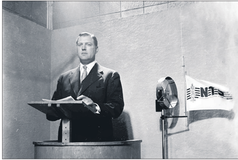
■ Tijdens een van de eerste tv-uitzendingen in 1951 wordt de werking van de televisie uitgelegd.