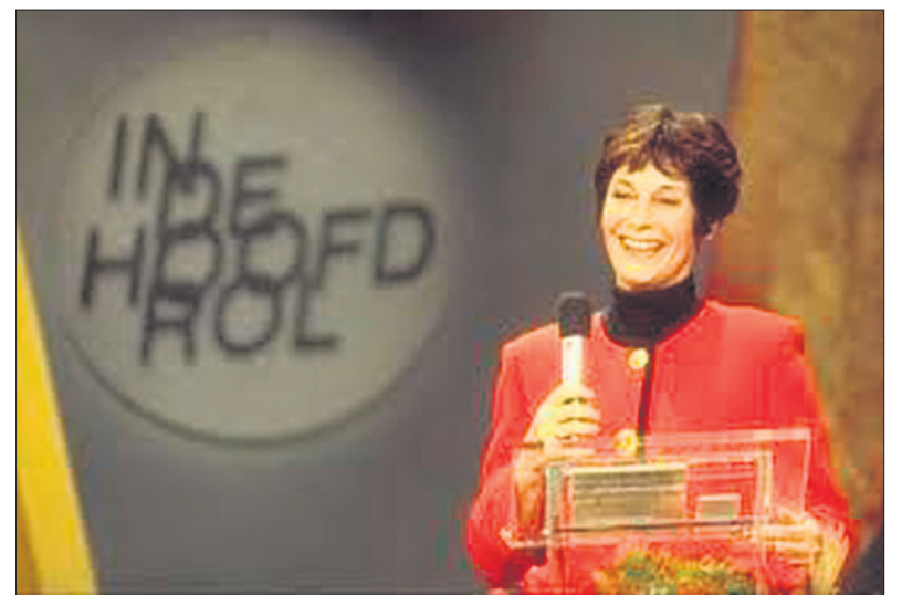
■ Mies Bouwman presenteert 'In de hoofdrol'.

van Lex Harding uit vanaf een vaste locatie: Studio III B in Bussum, ofwel het vroegere Elthetogebouw, dat achter de Vredekerk stond. Dit gebouw was oorspronkelijk het jeugdcentrum van de kerk, maar was al sinds 1956 bij de publieke omroepen als studio in gebruik geweest. In mei 1986 verliet de NOS studio Concordia en verhuisde Countdown daarheen. Vanaf september 1986 was het programma dagelijks te zien op Sky Channel. Op den duur vestigde ook de tv-zender The Music Factory zich in Concordia, net als de radiozenders 538 en Sky Radio.