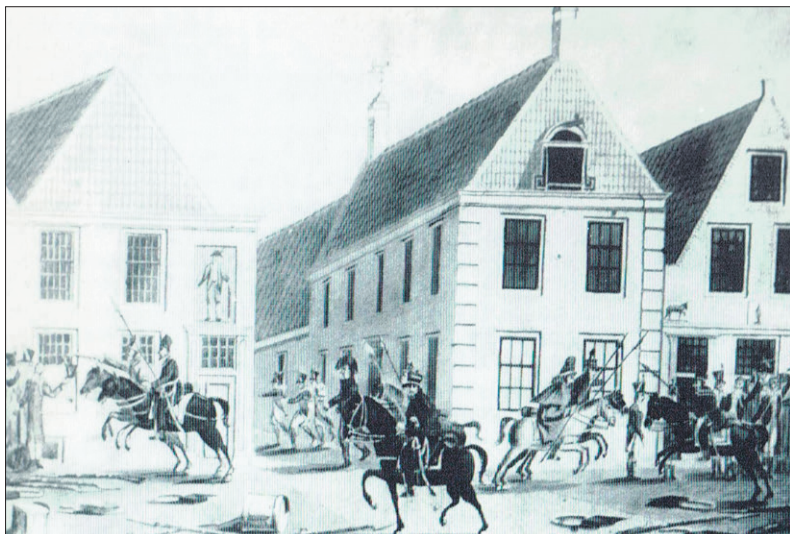
■ 1813: de Kozakken verslaan de Fransen. Op de achtergrond De Gooyse Boer.