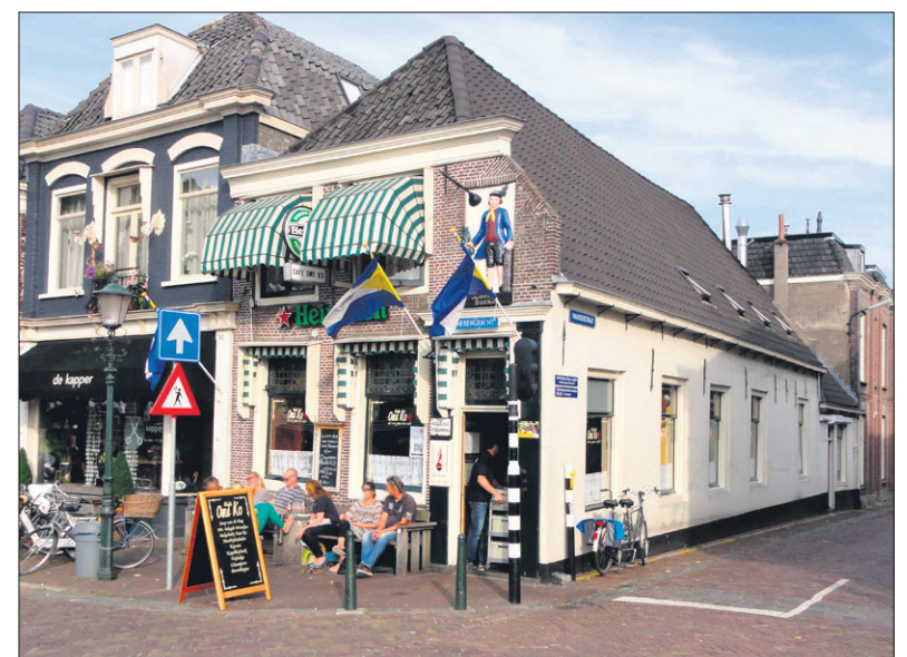
■ Het Café van Ome Ko.