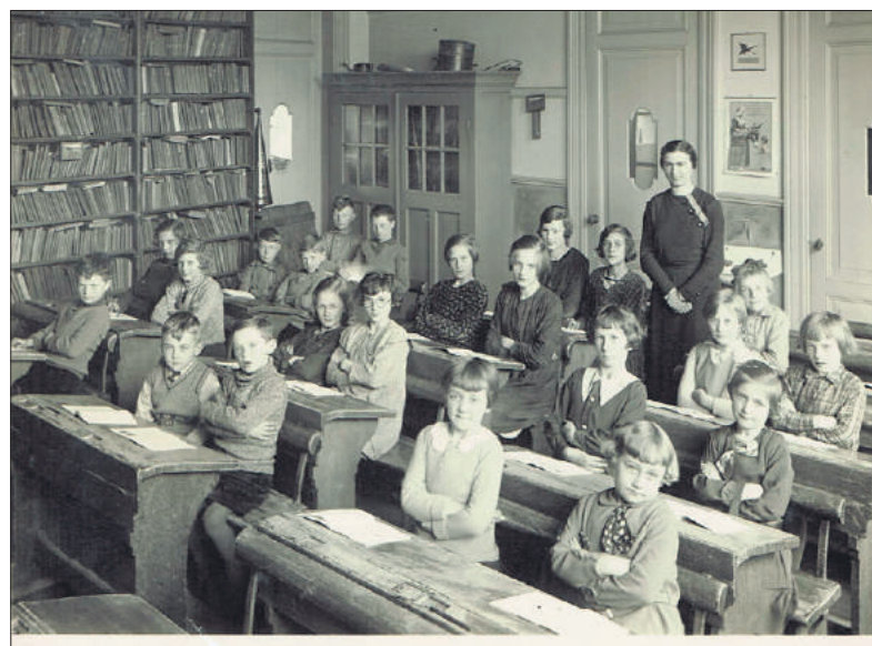
De bibliotheek in de Openbare Lagere School.