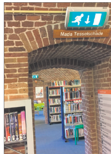
De afdeling Maria Tesselschade in 2022.