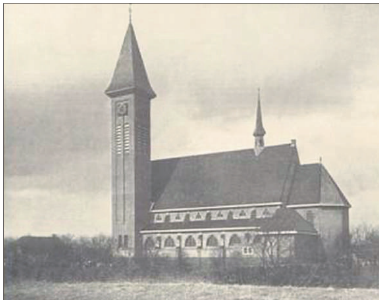
■ De kerk op de heide in 1932.

een hoogte tot een breedte, in die van licht tot donker. Een verdienste van deze kerk is nog de perfecte afwerking. Op de altaren heeft een edelsmid het tabernakel gemaakt hetwelk wordt omhuifd door een baldakijn van witte zijde waarop twee aanbiddende engelen zijn geborduurd. Het kruis met corpus aan den achterwand van het priesterkoor werd gemaakt door M. Andriessen, die ook het Mariabeeld vervaardigde. Alb. Termooten is de maker van het markante H. Hart-beeld'.