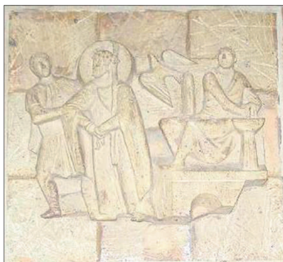
■ Een van de staties van Mari Andriessen.