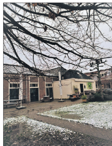
■ De zaal en het café in 2023.

In het café stond een biljarttafel waar veel gebruik van werd gemaakt. In de zaal, die via schuifdeuren met het café was verbonden, was een toneelopbouw met een zij-ingang. Die zaal bood plaats aan toneelvoorstellingen, verenigingsbijeenkomsten, bruiloften en andere festiviteiten. In de pauze van een voorstelling gingen de schuifdeuren open en kon je aan de bar een drankje halen. Frits en Do brachten de bestellingen desgevraagd ook aan tafel. Na een voorstelling gingen de stoelen