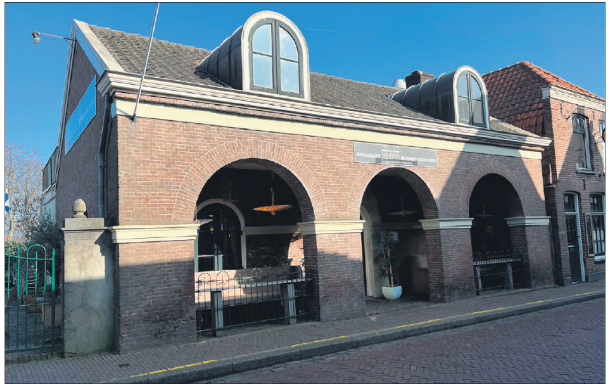
■ De Poort van Muiden nu.

Omdat men vanaf 1850 rekening hield met een Pruisische inval in Nederland, versterkte men de fortificaties en de poorten: de Keetpoort, de Weesperpoort en de Naarderpoort. Hiervoor was personeel nodig en dat moest worden ondergebracht. Het pand werd in 1855 verkocht aan het Koninkrijk der Nederlanden. Alle opstallen werden gesloopt en tekening en bestek voor nieuwbouw werden in november 1855 goedgekeurd. Op de tekening wordt het nieuwe