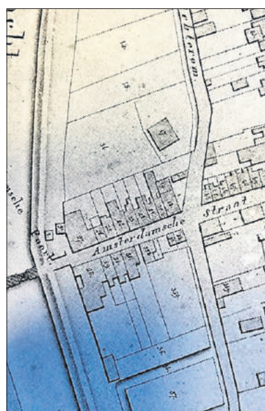
■ Kadasterkaart uit 1836: kavel 27 direct naast de Amsterdamse Poort.