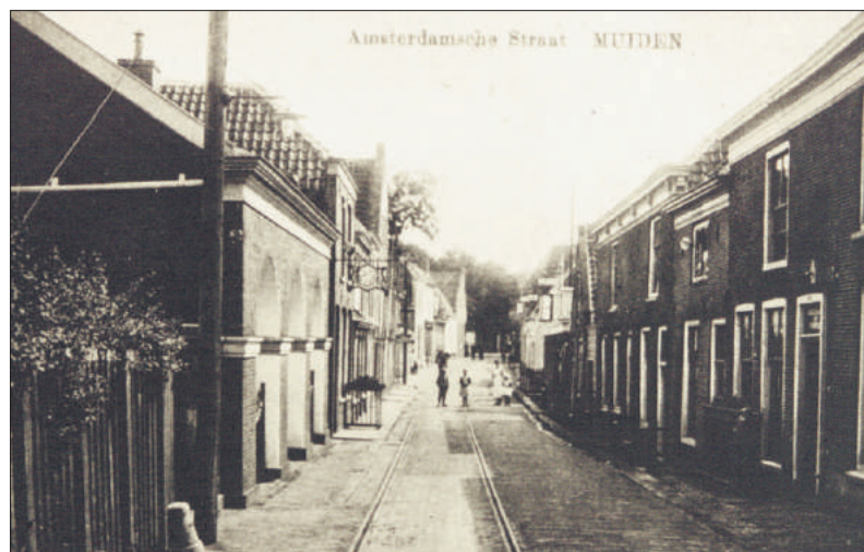
■ Ansichtkaart uit 1900: Amsterdamsestraat gezien vanaf de poort.