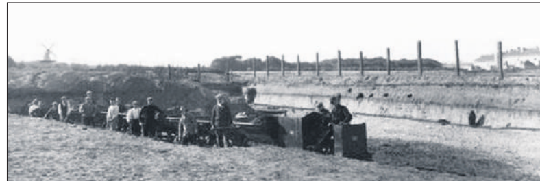
Afzanding op de Eng (nu de Groene Long) met treintje in 1931.

In 1674 geboden de Staten dat al het hoge land tot op driehonderd roeden (ruim een kilometer) rond Naarden afgegraven moest worden. Het zand werd via de Naarder- en de Muidertrekvaart naar Amster-