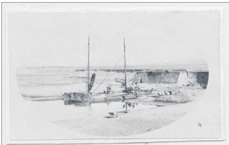
Afzanding nabij de Marconiweg omstreeks 1890.