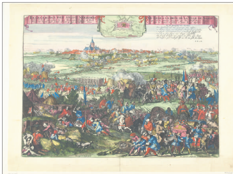
Romeyn de Hooghe, De belegering van Naarden in 1673 (Rijksmuseum).