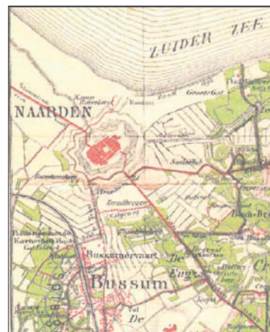
Het web van afzandingsloten in 1890.