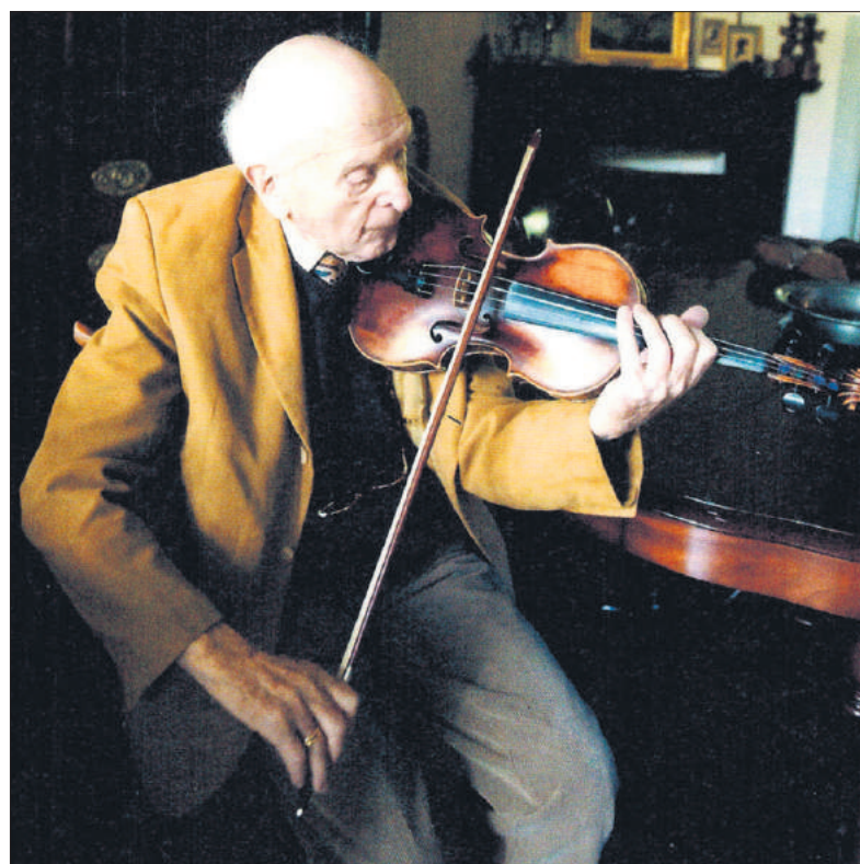
Foto van Hans Keilson in Die Welt toen hij de WELT-Literatuurpreis 2008 won.

De biografie geeft een compleet beeld van Hans Keilson: de hoffelijke, geestige en intelligente maar ook beschadigde echtgenoot en minnaar, psychiater en psycho-analyticus, sportliefhebber, musicus, schrijver en dichter. Keilson kwam met zijn verloofde in 1936 naar Nederland. Ze woonden eerst in Amsterdam, maar vertrokken al snel naar Naarden. In 1941 kregen ze een dochter, maar konden toen niet trouwen; dat gebeurde pas in 1945. Keilson zat ondergedoken in Gelderland en Delft en schreef gedichten en proza.