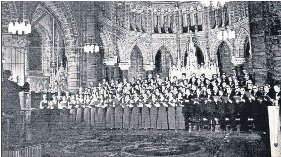
■ Pro Musica in de jaren 50. Plaats en datum van deze foto zijn onbekend.

sum. In juni 1956 werd een tegenbezoek gebracht. Ruim honderd leden, meest (huis)vrouwen – de mannen moesten werken – vertrokken in de nacht van 14 op 15 juni naar Engeland. Natuurlijk niet per vliegtuig!