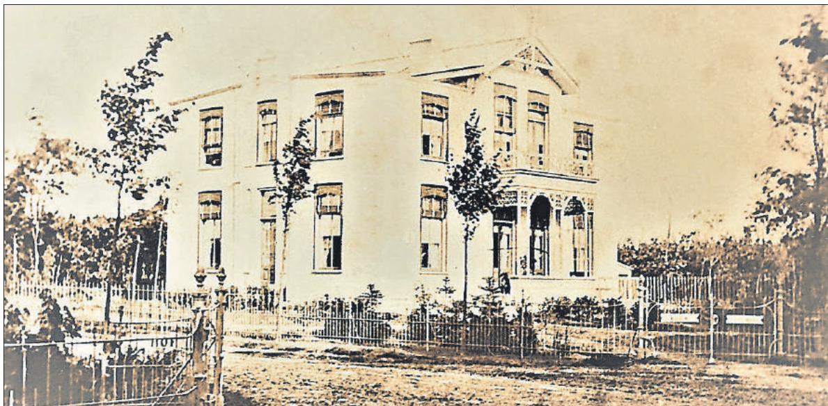
■ Villa Parkzicht aan de Parklaan 4.

Ze werd als pensionhouder opgevolgd door het Duitse echtpaar