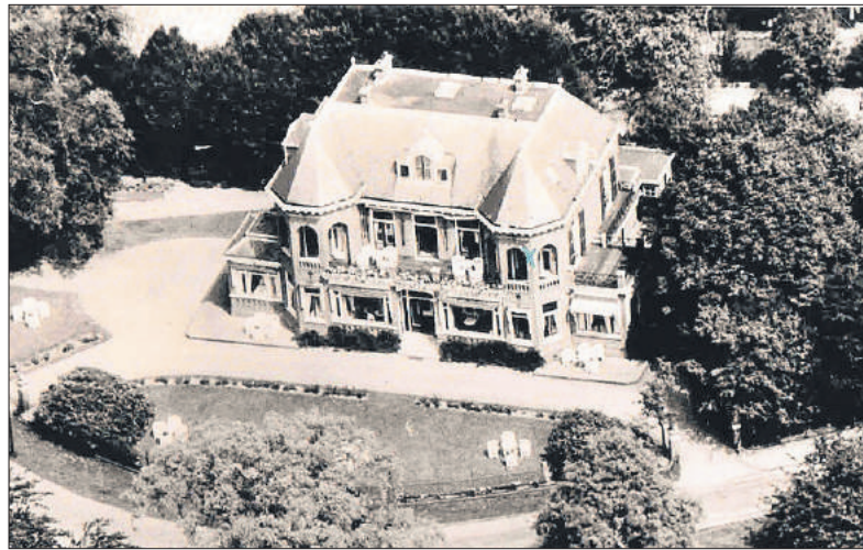
■ Hotel Edinoor omstreeks 1960.