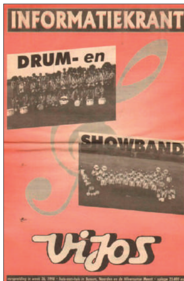
■ Informatiekrantje uit 1998.

In de vierde klas mocht men beginnen, in de vijfde en zesde klas mochten de jongens meedoen. De band bestond alleen uit jongens, want we kenden toen alleen jongensscholen.