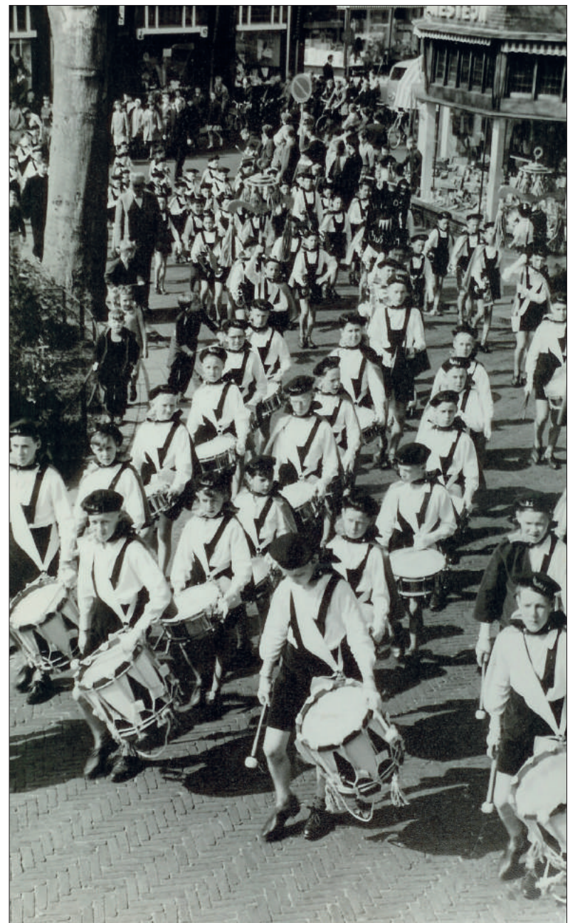
■ De drumband Vijos kort na de oprichting; er zijn nog geen meisjes bij.