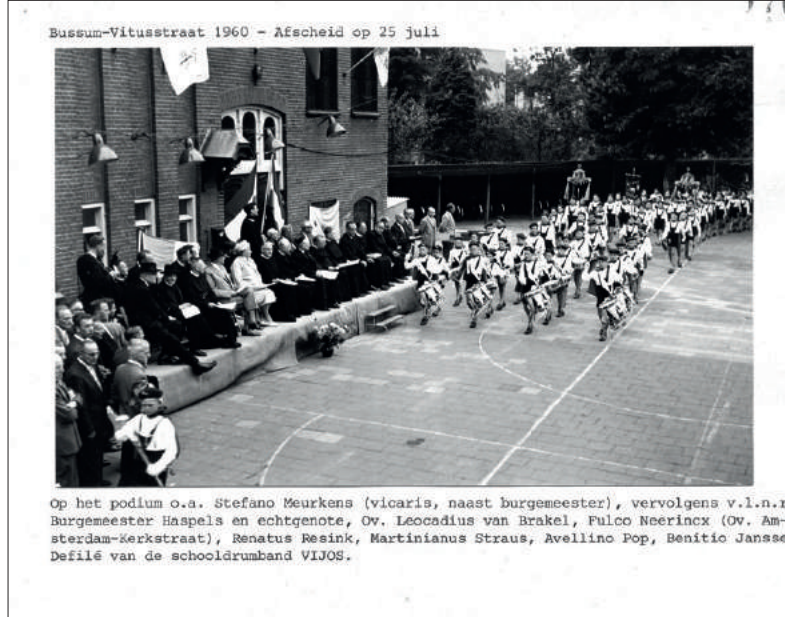
■ Bij het afscheid van de Broeders van Maastricht, in 1960.