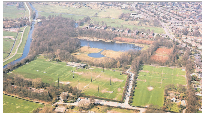
■ Het Laegieskamp in 1975.

Bij de ijsbaan werd een huisje geplaatst van waaruit als de ijsbaan geopend was koek-en-zopie kon worden verkocht. De Bussumsche krant meldde dat deze voorziening niet werd gewaardeerd door de 'nymfen van het Lyceum en