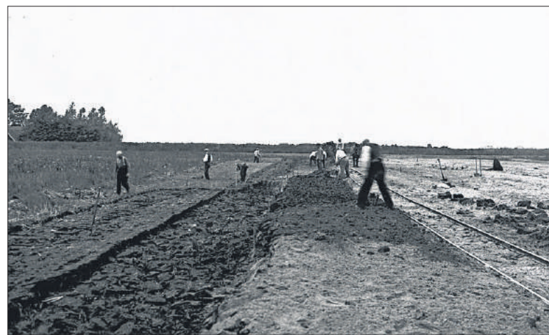
■ De aanleg van sportvelden in 1932.

Verder zou er een grote vijver komen met een diepte van 50 centimeter, een lengte van 181 meter en een breedte van 82 meter, die 's winters als ijsbaan kon dienen. Verder waren een kleine ronde