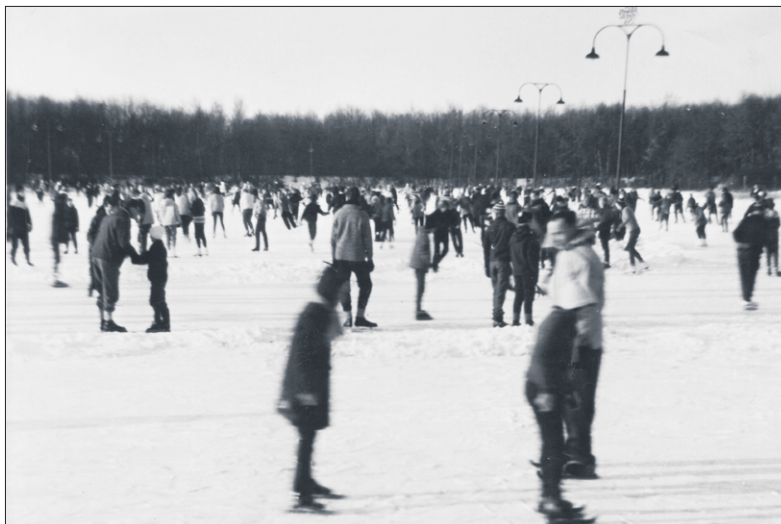
■ De ijsbaan in 1960.

vanaf 1918 het Laegieskamp van Hilversum, met het idee er sportvelden en/of een vuilstortplaats te realiseren. In 1926 kocht Bussum het gebied om er een vuilstortplaats van te maken. Hiertegen kwamen echter verscheidene raadsleden in het geweer: de geur zou hinderlijk zijn voor de omwonenden en de bezoekers van het zwembad, dat in 1924 op de Ondermeent aan de andere zijde van de Meerweg achter de voetbalvelden gerealiseerd was. Bovendien zouden de vuilniswagens door het Spiegel moeten, hetgeen op tegenstand van de bewoners zou stuiten.