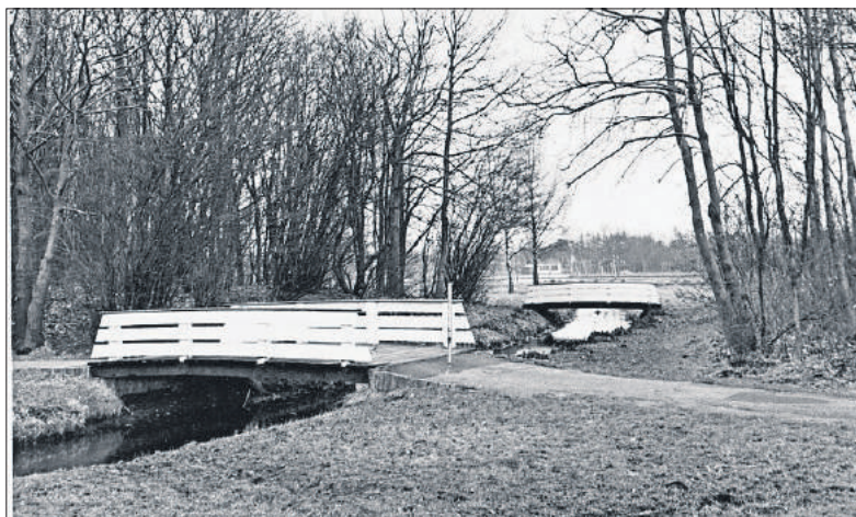
■ Het wandelpark in 1960.

de HBS' omdat ze het maar een onhygiënische toestand vonden. In later jaren kwam er ook een kantoortje voor de afgifte van schoenen. Daarnaast kwam er elektrische verlichting. In de oorlogsjaren werden aan de oostkant van het Laegieskamp tennisbanen aangelegd en nog later ook aan de noordkant. De ijsbaan heeft bestaan tot 1968. Tegenwoordig is het middelste deel van het Laegieskamp niet meer toegankelijk. Alleen vanaf de paden eromheen kan men dit bijzondere gebied nog zien.