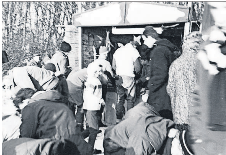
■ Het kantoortje voor afgifte van de schoenen.

In februari 1932 presenteerde de directeur van gemeentewerken een 'plan voor de inrichting van Laegieskamp als verpozingsoord'. Het plan voorzag in drie hockeybanen, een extra voetbalveld en een veld voor korfbal of atletiek.