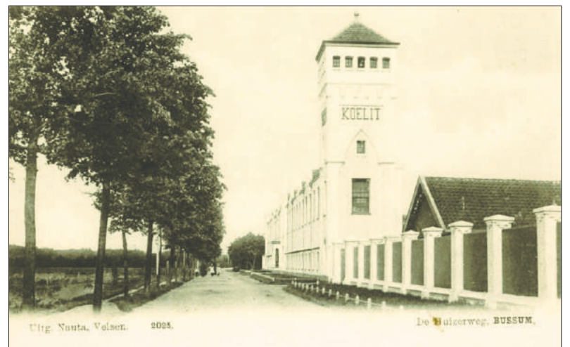
De fabriek stond nog voorbij de leerfabriek Koelitt op de Huizerweg, niet zichtbaar op de foto.

bouwen op steenen voet, paardenstal, kolenbergplaats en verdere getimmerden.' De firmanaam wordt N.V. Chemische Fabriek 'Jumbo'. Op 1 juli 1899 deponereert directeur Mijnders het beeldmerk van zijn product, met daarin de voor-