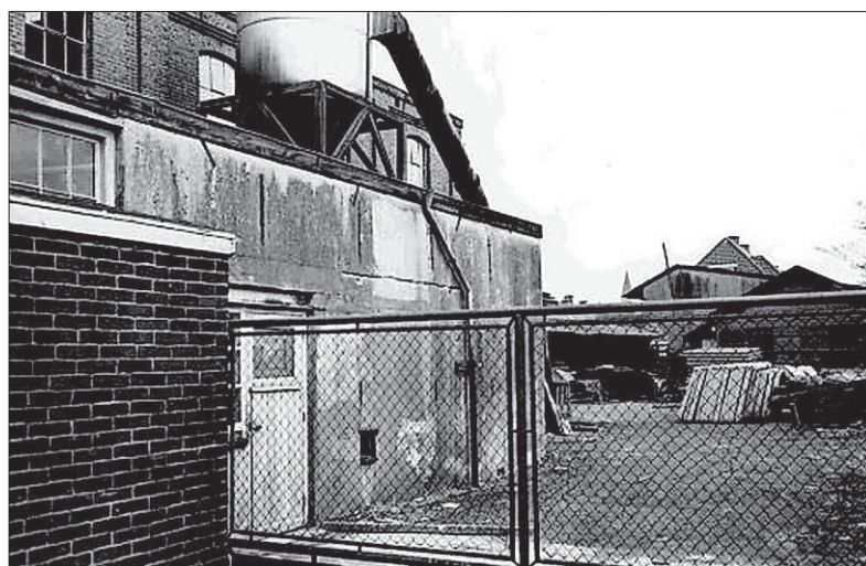
De timmerfabriek in 1935.

FOTO EN TEKST: ARCHIEF GOOI EN VECHTSTREEK