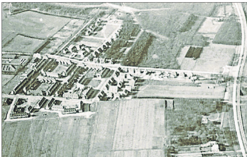
Op deze luchtfoto staat de fabriek op het lange perceel links van de nieuwgebouwde huizen.

Bron: Dit artikel werd eerder gepubliceerd in Bussums Historisch Tijdschrift 37.1 van april 2021.