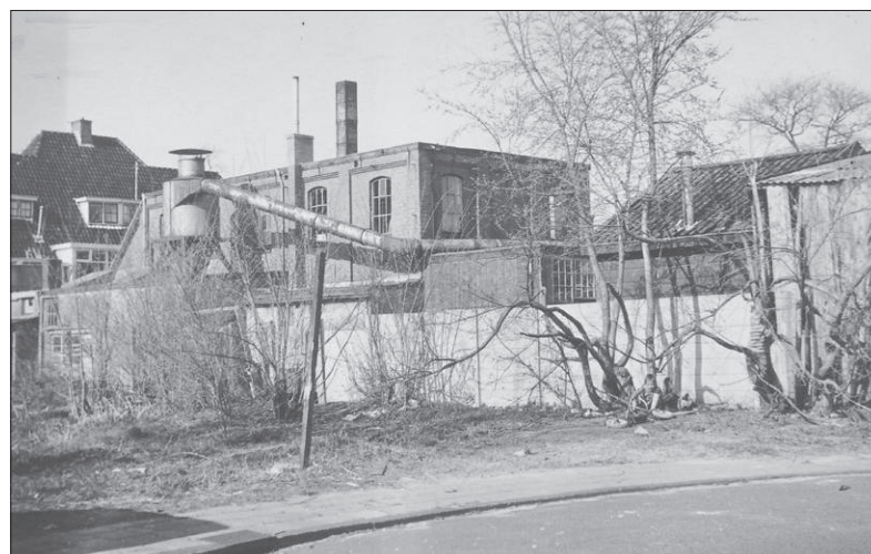
De voormalige fabriek gezien vanuit de Karbouwstraat in 1965.