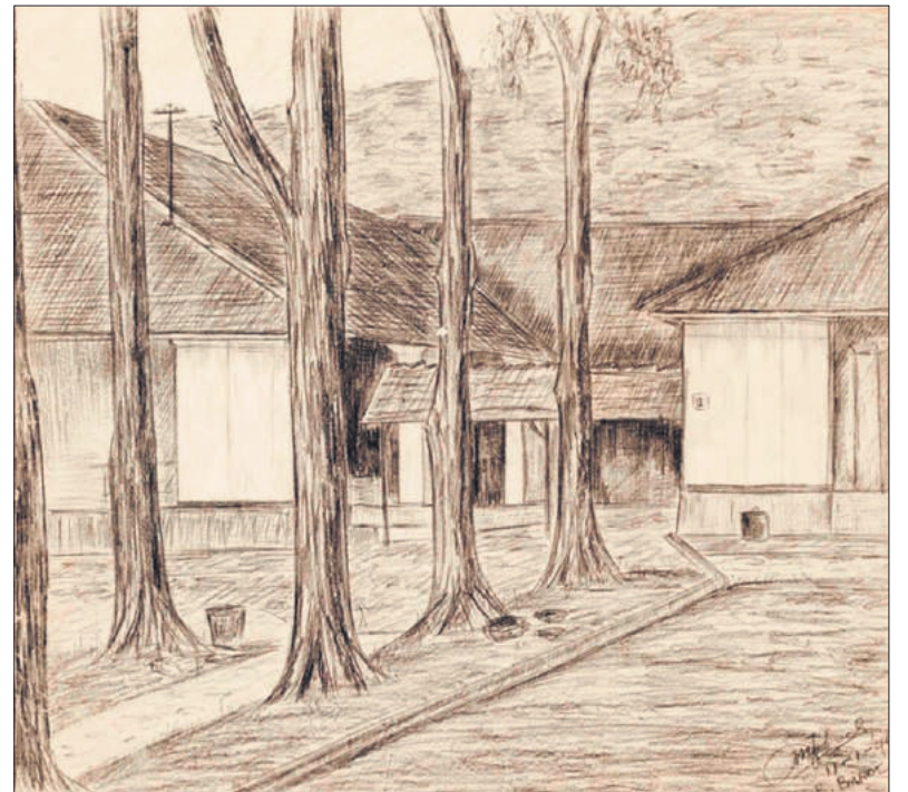
■ Kampgezicht Banjoe Biroe. Tekening van J. Mobach.