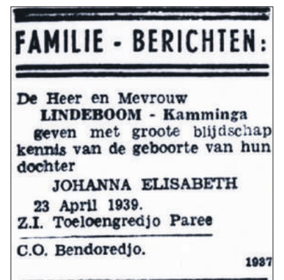
■ Uit Soerabajasch Handelsblad van 24 juni 1939.