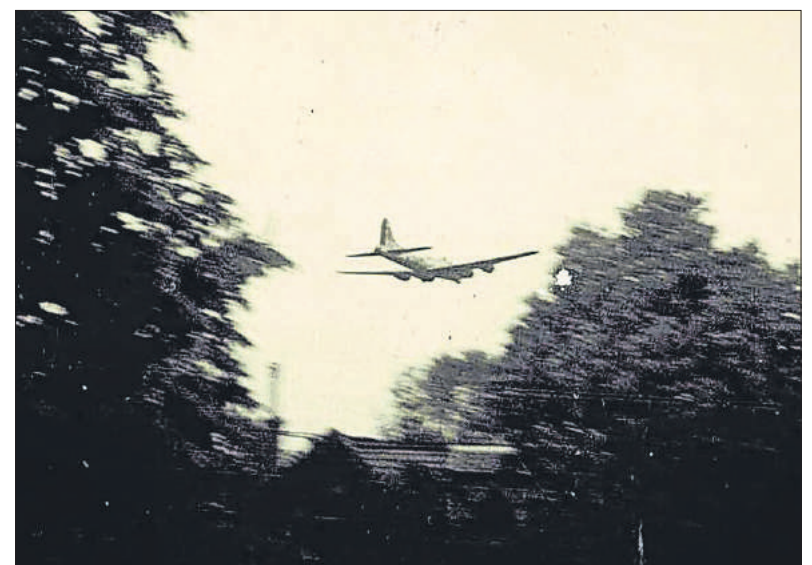
■ 2 mei 1945: Bommenwerpers droppen voedsel.

21 Maart. Wij lagen nog in bed, toen we plotseling het gehuil van duikende vliegtuigen hoorden, doffe dreunen in de verte en de