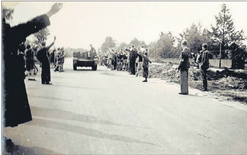
■ De bevrijders rijden het Gooi binnen.