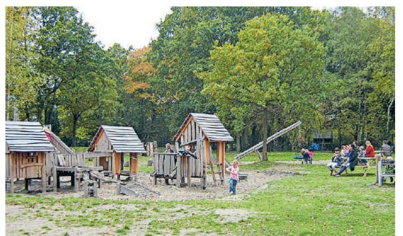
■ Speeltuin Heidezicht in 2012.