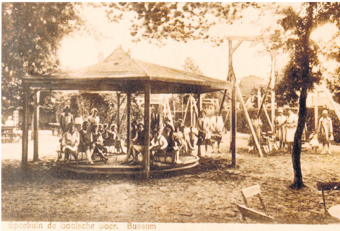
■ De speeltuin van De Gooische Boer omstreeks 1930.

Hoewel daarvoor in het uitbreidingsplan geen ruimte was, kwam er op tijdelijke basis toch een speeltuintje. Het heeft dienst gedaan tot halverwege de jaren 60,