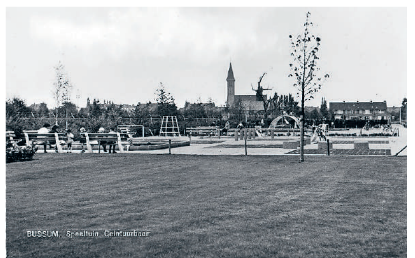
■ De speeltuin aan de Ceintuurbaan gezien in de richting van de Lorentzweg.