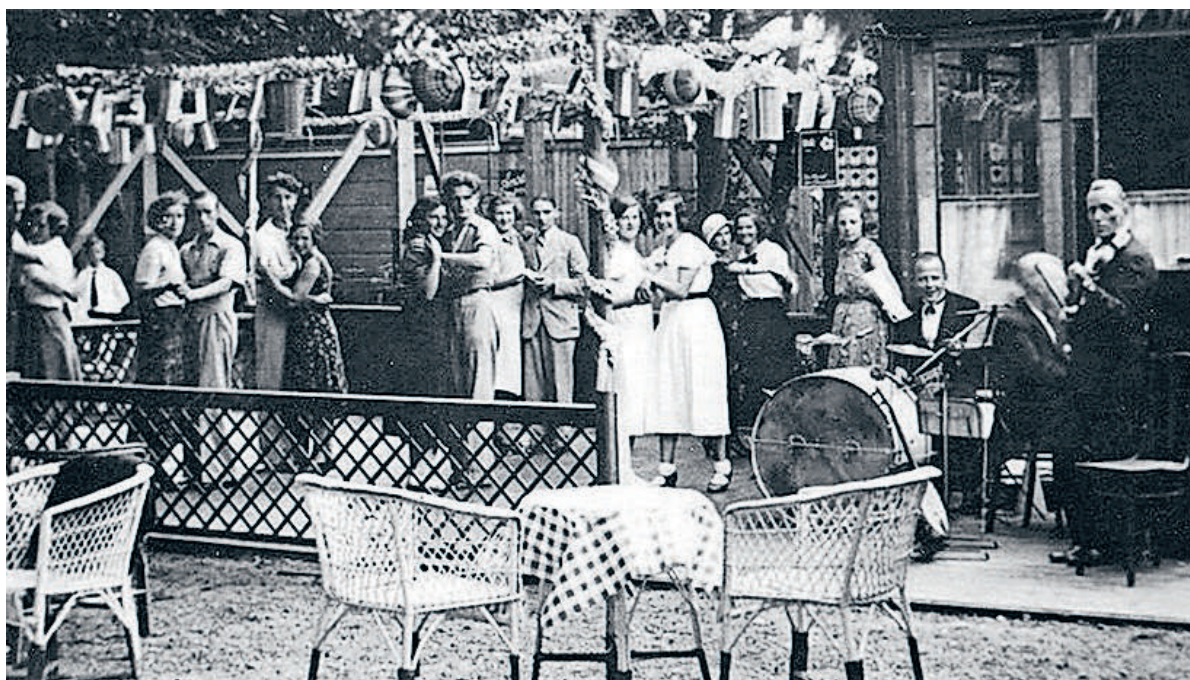
■ Dansen op levende muziek in 1935.

Buwito, de manifestatie van de Bussumse Winkeliersvereniging. Eind jaren 70 kwam verderop aan de Ceintuurbaan, nabij de H.A. Lorentzweg, een speeltuin met een rolschaatsbaan.