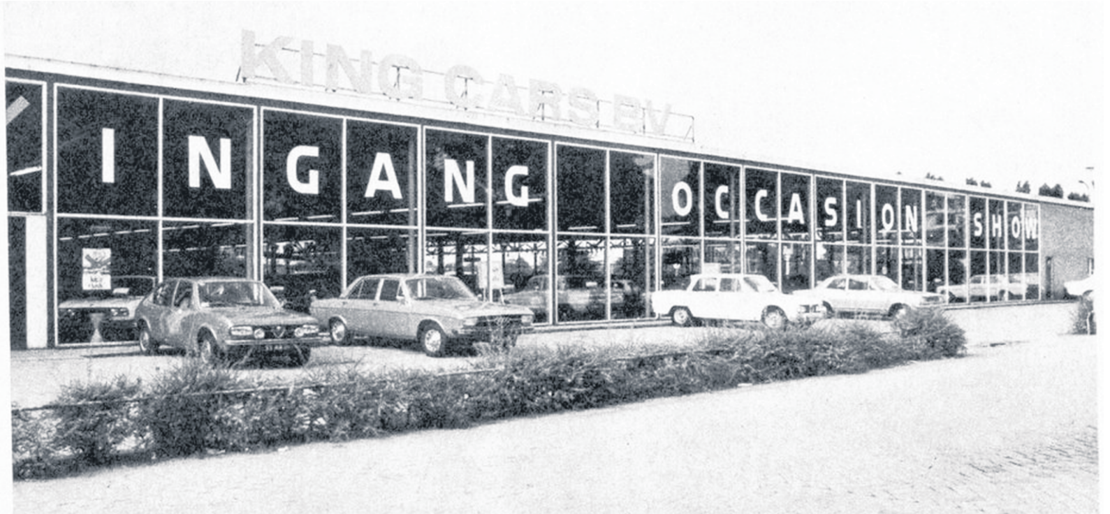
■ King Cars in de jaren 70 langs de toenmalige Rijksweg.