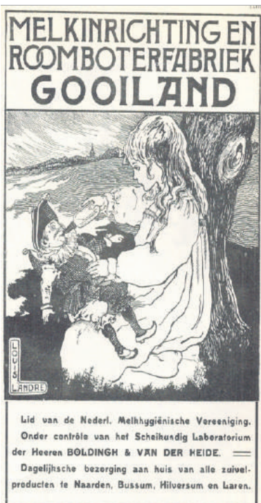
■ Advertentie uit 1905 van de melkfabriek.