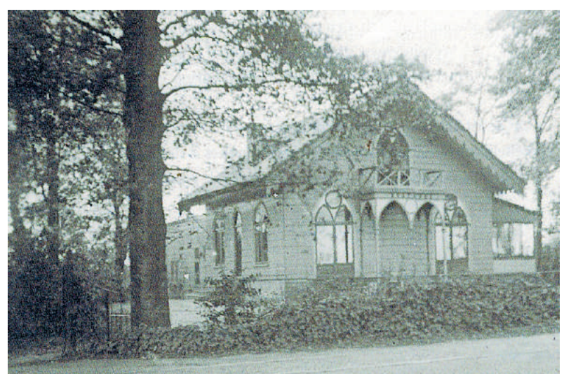
■ Buitenhuis Rusthoek.