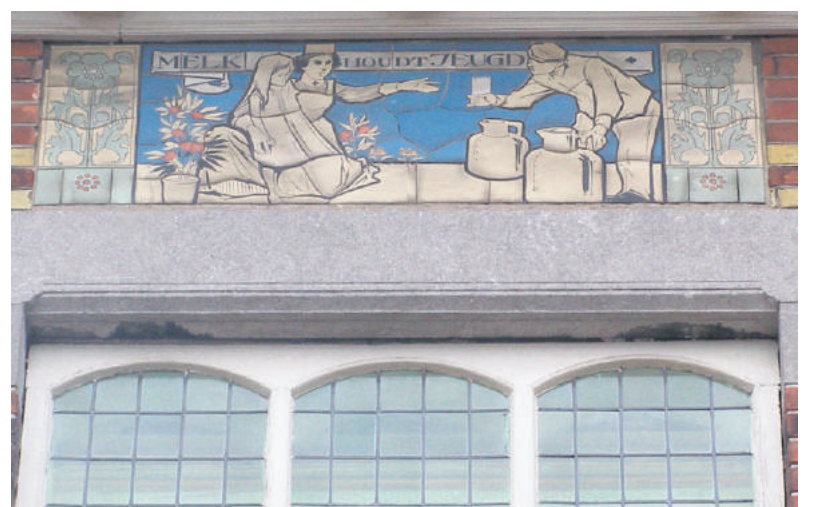
■ Eén van de drie tegeltableaus uit 1919 in de gevel van de melkschenkerij van Gooiland in de Nassaulaan in Bussum (nu Kruitvat).