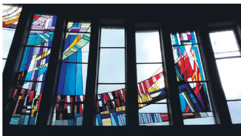
■ Glas-in-loodraam in de westgevel.