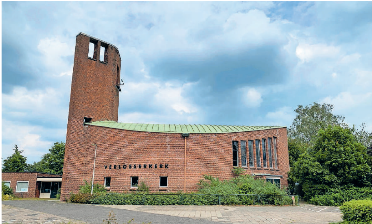
■ De westgevel van de kerk.

Ze ontwierpen een ovale kerk zonder kerktoren. Om de kosten te drukken zou de kerk met eenvoudige rode bakstenen worden ge-