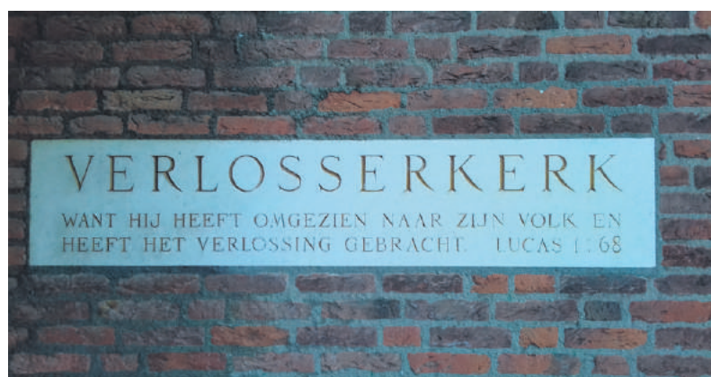
■ De plaquette met het Bijbelcitaat.