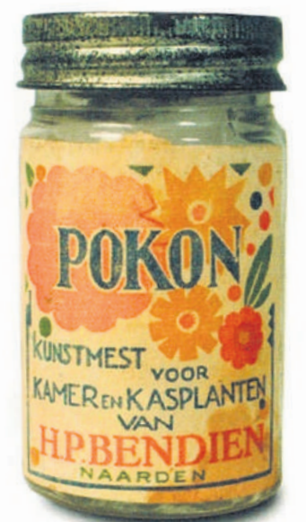
■ Het allereerste Pokon potje in 1929.