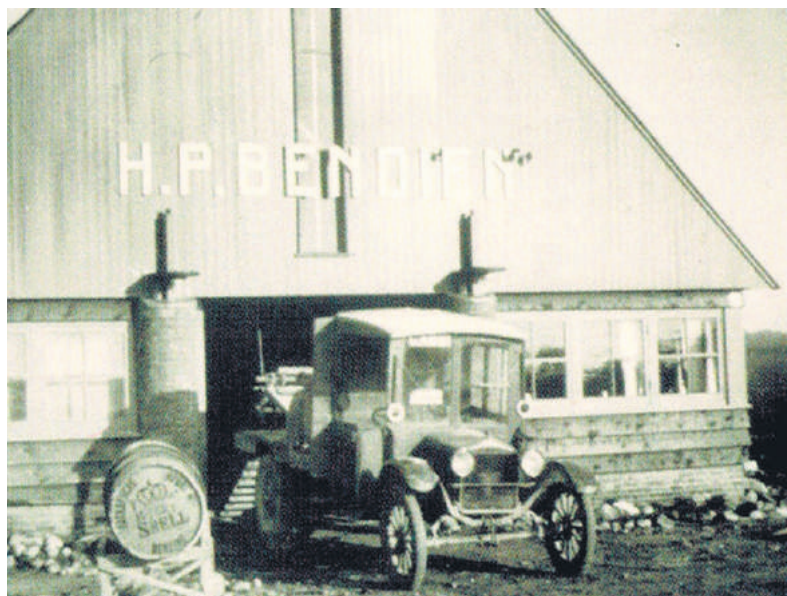
■ De nieuwe loods aan de Thierensweg in 1929.