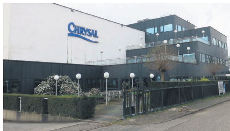
■ Het bedrijfspand in Naarden.