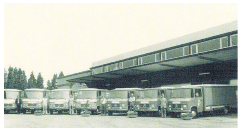
■ Het wagenpark in 1977.

merknaam van de erfgenamen van Buys. In het bedrijf spreken ze wel over het huwelijk van het Pokon-mannetje en het Chrysal-vrouwetje.