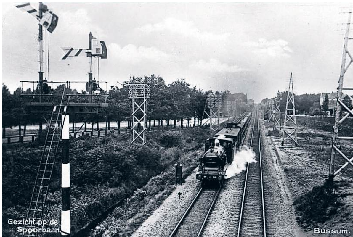
■ Een stoomtrein door je achtertuin...

was de bevolking van Bussum verdubbeld en dat tempo zou nog enkele decennia aanhouden. Een spoorlijn door je achtertuin Stel je ook eens voor wat dat voor de Bussumers van 1874 moet heb-