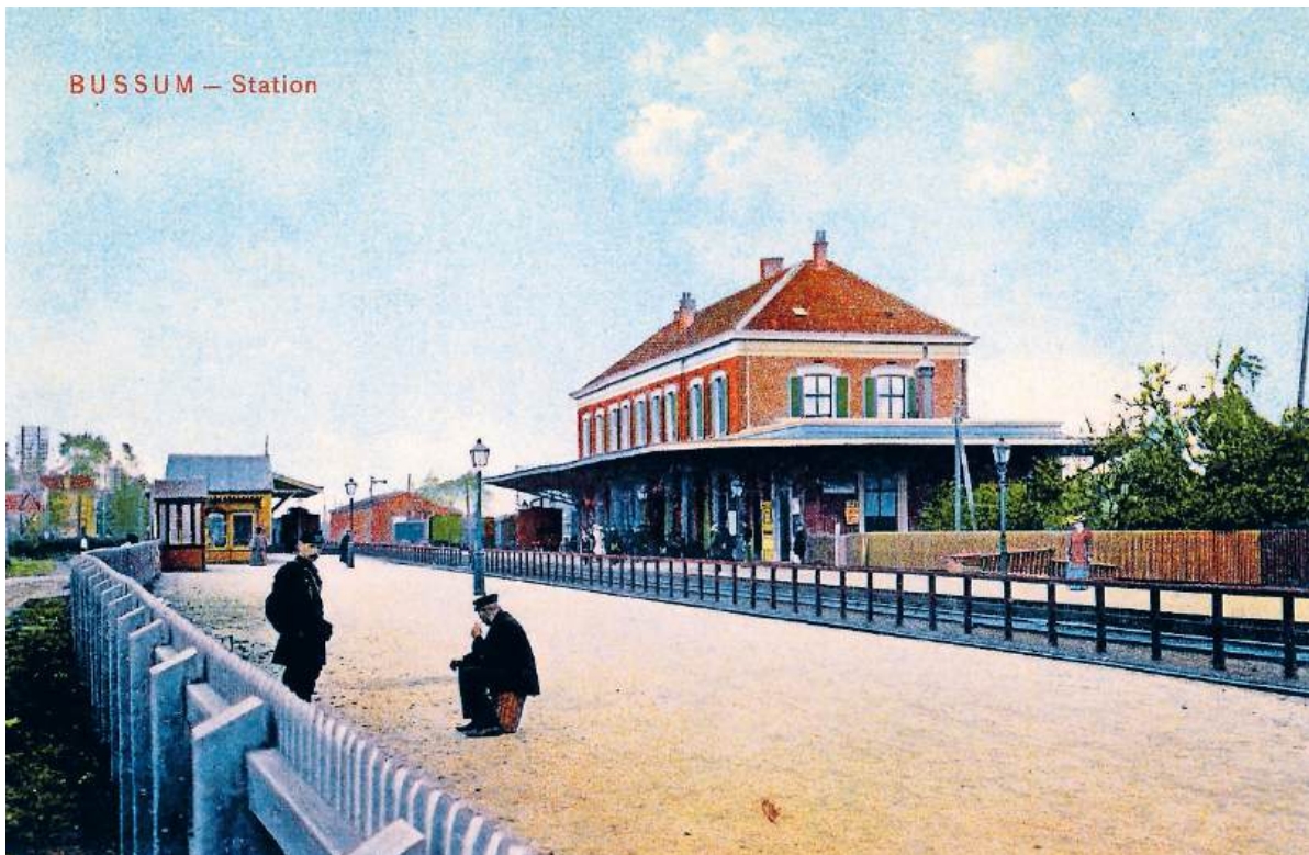
■ Het eerste station Naarden-Bussum (1874). Foto:

Boegbeeld van de Oosterspoorweg is natuurlijk het prachtige stationsgebouw uit 1926, niet voor niets een Provinciaal Monument. Het heeft oneindig veel meer allure dan het simpele eerste stationnetje dat in 1874 werd gebouwd om de reizigers bij vertrek en aankomst een bescheiden onderdak te bieden in een ietwat troosteloze omgeving. In 1874 lag het station Naarden-Bussum namelijk verloren in een niemandsland tussen het vestingstadje Naarden en het boerendorp Bussum. Er was zelfs nauwelijks een weg waarlangs je met goed fatsoen het station kon bereiken. Maar dat zou snel veranderen. Niet door toedoen van de Bussumers, die aanvankelijk weinig op hadden met al die nieuwigheden. Maar een aantal onderneemende buitenstaanders zag wel de kansen die de nieuwe spoorweg bood. Door hun initiatief ontstond er al snel een villawijk in het Spiegel. En de rest is geschiedenis... Binnen tien jaar