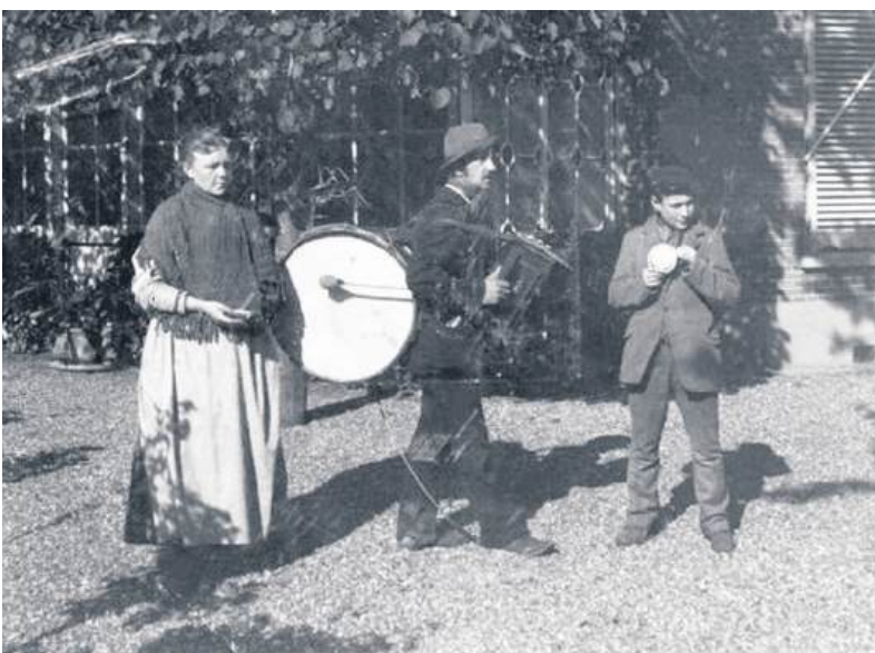
■ Straatmuzikanten in de tuin van de Rozenboom 1900.

Doordat Bussum rond 1900 langzamerhand veel welgestelde inwoners had, werd het ook voor straatmuzikanten een interessant werkterrein. De Historische Kring Bussum heeft twee foto's van straatmuzikanten uit die tijd in zijn archief: de ene is ge-