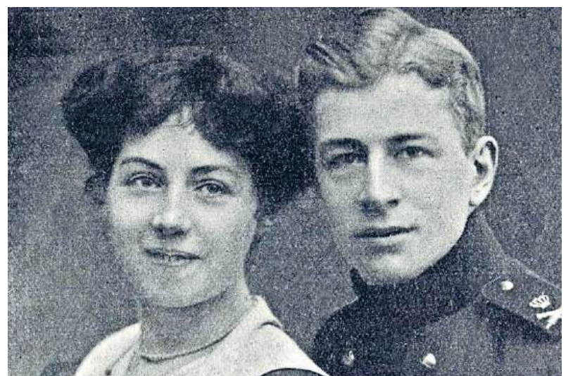
■ Hens en Bien Clinge Doorenbos omstreeks 1914.