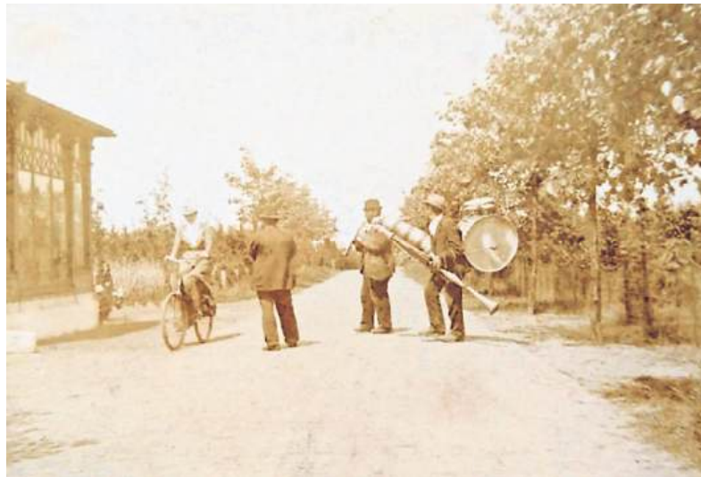
■ Italiaanse straatmuzikanten in 1902.

nomen in de tuin van De Roozenboom en de andere op de Vlietlaan. In 1902 stelt een ‘Buurman v/d Veerkamp’ (het terrein waar zich nu de Wilhelminakerk en het Wilhelminaplantsoen bevinden) in een ingezonden brief in