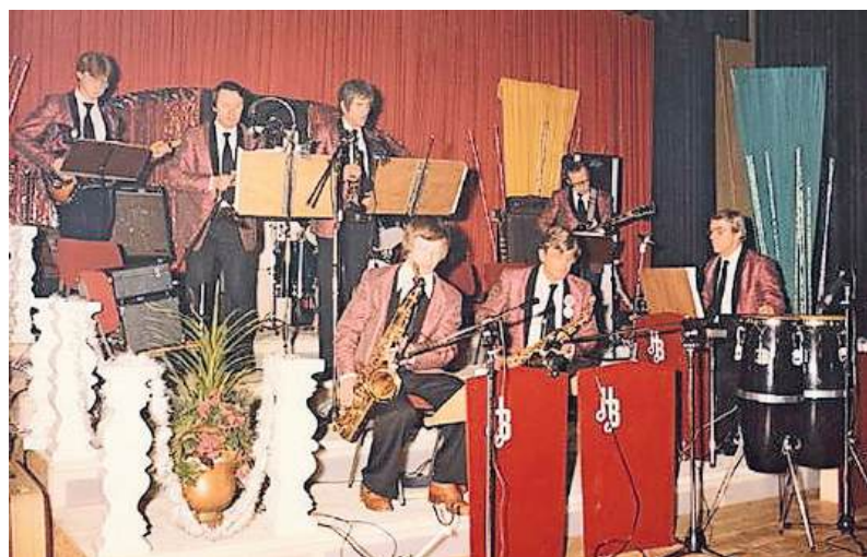
■ The Heartbreakers.

Maar soms kwam er plotseling een vreemde. Ik herinner me de “Kopen Ko” en ook een man met een zingende zaag. Er kwam ook eens een open vrachtwagentje met een piano erop. De muzikanten waren vier Duitsers. Er was één pianist bij, maar ik weet niet meer wat de andere drie deden. Maar wij vonden het geweldig interessant. Een piano zagen wij niet zo vaak en een vreemde taal hoorden we ook nooit. Mijn oudere zuster herinnert zich Johannes de Heer; ook op een open vrachtautootje met daarop een orgeltje. Hij ging dan op de hoek van de Bijlstraat zijn zelfgemaakte christelijke liederen