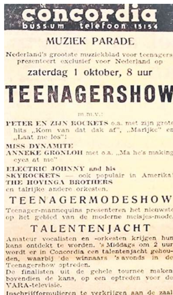
■ Advertentie Bussumse Courant 24-09-1960.