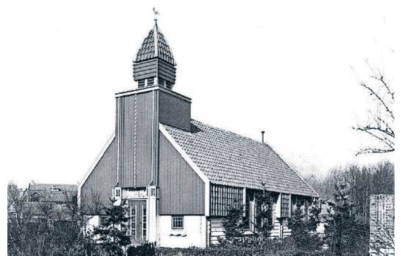
■ De Jeugdkapel aan de Meentweg.