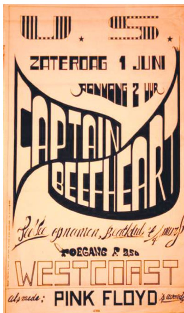
■ Affiche van 't Smurf.

Popconcerten Al in 1960 organiseerde het jeugdblad Muziek Parade een 'Teenagershow' in Concordia. Naast optredens van sterren als Peter en