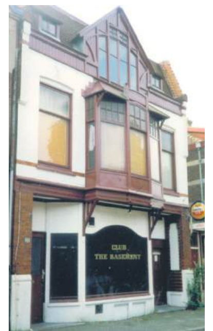
■ Nachtclub The Basement aan de Herenstraat.

zijn Rockets en Anneke Grönloh was er een 'teenagermodeshow' en een talentenjacht aan verbonden. In 1965 en 1966 waren er 'beatfestijnen' in de vorm van talentenjachten waarbij verschillende Gooise bands optraden. Op 5 mei 1965 was de locatie de camping Het Franse Kamp en op 30 april 1966 werd gekozen voor Sportpark Zuid. In januari 1967 en april 1968 werden beatfestijnen (met minder bands) georganiseerd in de raadhuiskelder.