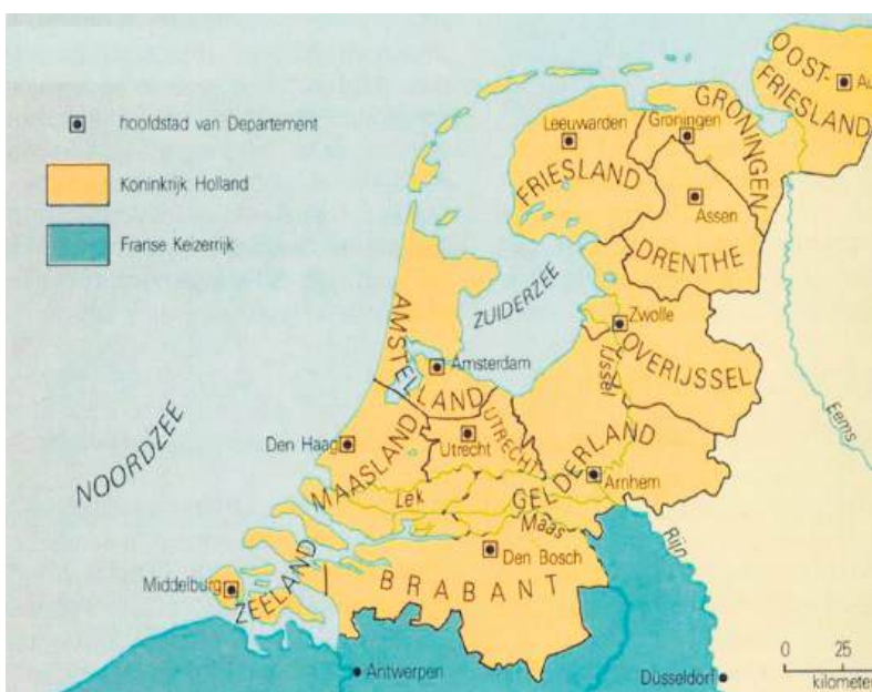
■ Het koninkrijk Holland omstreeks 1809.

In diverse bronnen wordt een link gelegd tussen De Fransche Kamp en de aanwezigheid van Franse troepen hier in het rampjaar 1672. Die troepen hebben inderdaad toen flink huisgehouden rond Naarden en bij 's-Graveland, maar daar is niet de naam Fransche Kamp aan ontleend.