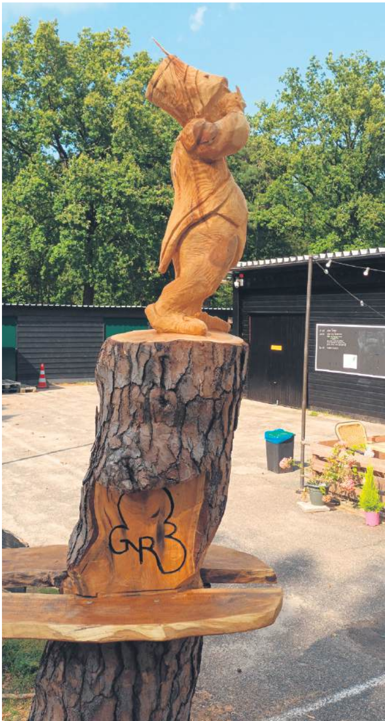
■ Het boomkunstbeeld van het soldaatje.

Eind juli 1809 vertrokken de troepen spoorlags via Gorkum naar de linie tussen Willemstad en Bergen op Zoom op de grens van Zeeland. Een paar dagen ervoor waren de Britten op Walcheren geland, met de bedoeling Vlissingen te veroveren om