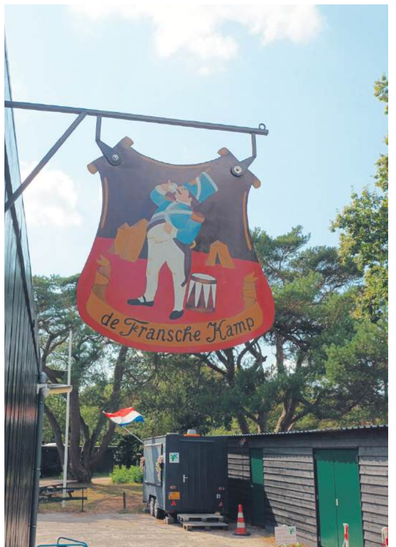
■ Het uithangbord bij de receptie.