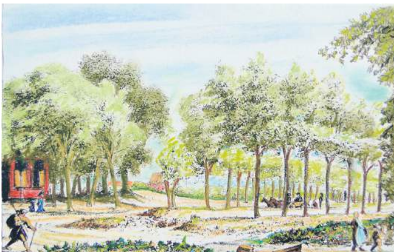
■ Het uitzicht uit herberg De Orangeboom in 1784, getekend door Stefan Goblé en ingekleurd door Gerard Langemeijer.

met Sinterklaas of Kerstmis cadeau wil krijgen – of geven. Het boekje is vanaf vrijdagmiddag aanstaande voor € 19,95 verkrijgbaar bij boekhandel Los in Bussum.