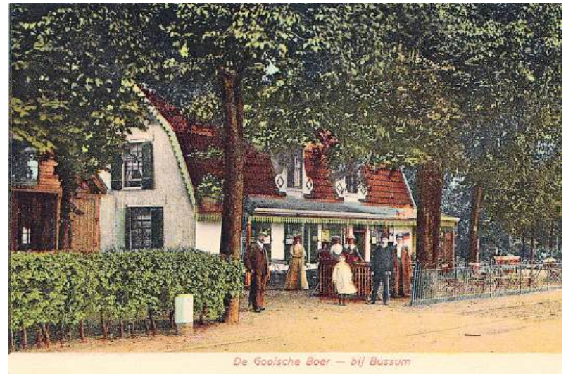
■ De Gooische Boer in 1905.