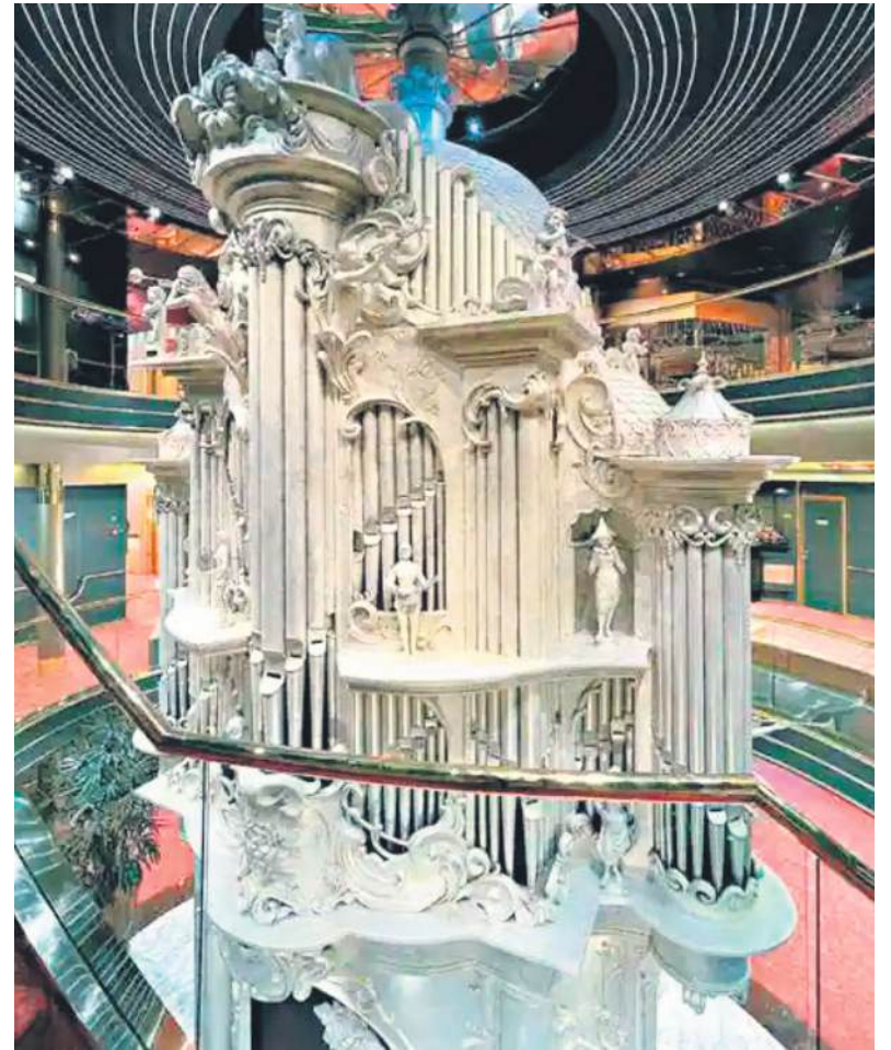
■ Het orgel van Elbert in het atrium van het schip 'Zaandam'.

In 2021 ben ik gestopt met het bedrijf. Reparatie en restauratie heb ik afgestoten en opdrachten voor orgels neem ik niet meer aan. Dat betekent niet dat ik geen orgel meer bouw. Al tien jaar werk