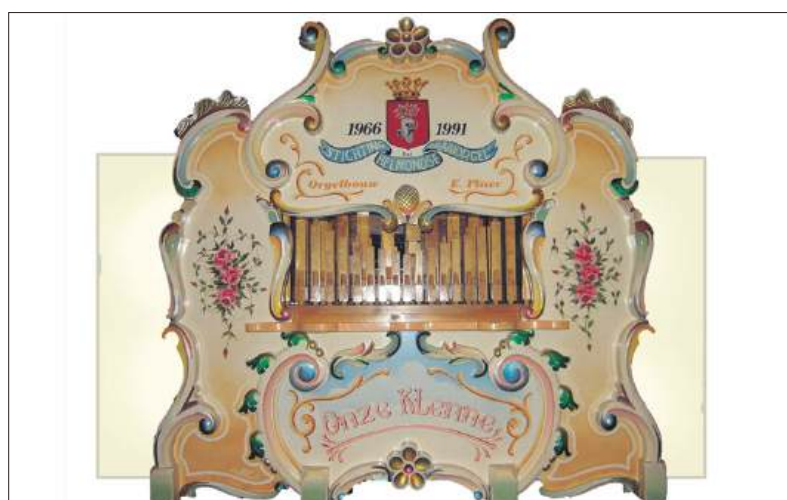
■ Onze Klenne' in 1991 gebouwd voor Draaiorgelmuseum in Helmond.