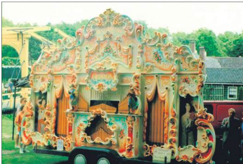
■ Het grote draaiorgel 'De Lotusfluit' van Elbert.