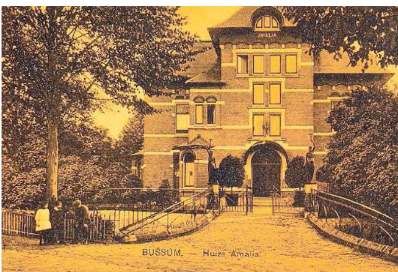
■ Villa Amalia.