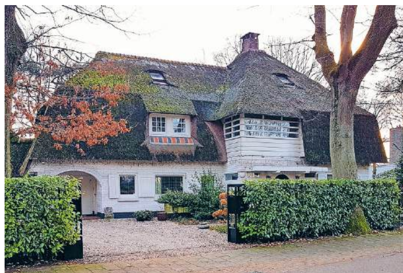
■ Isaac da Costalaan 22.