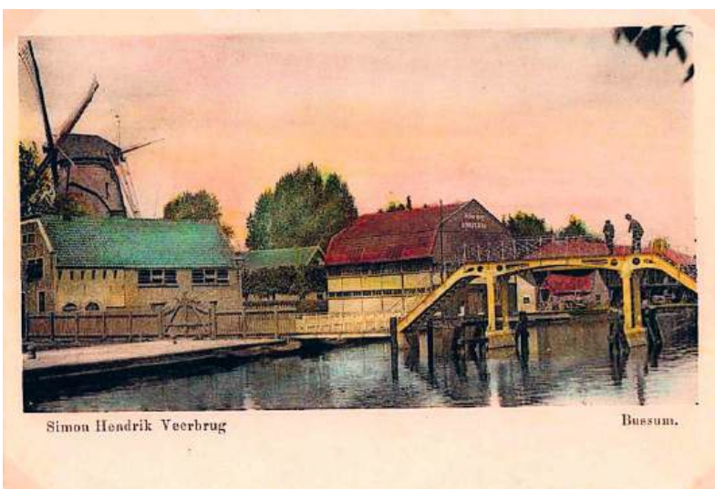
■ Rechts van de brug de houtloods van Weitjens (gezien vanaf de Landstraat).