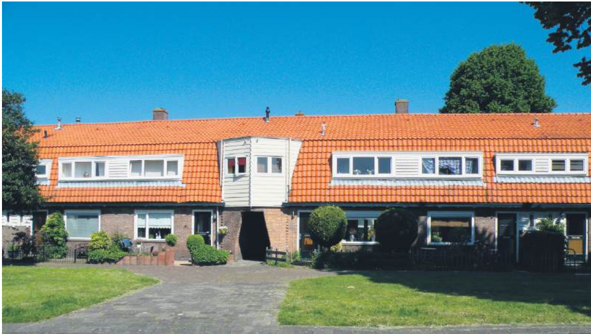
■ Deel van de lange rij woningen aan het Oosterpad.