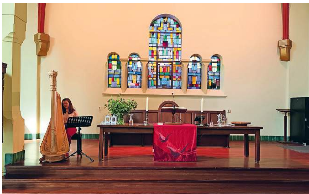
■ Liturgisch centrum van de Spieghelkerk.