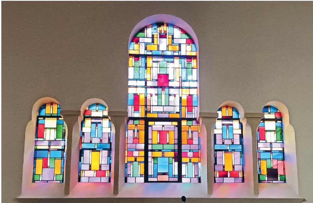
■ Glas-in-lood ramen.

De kerkzaal heeft een donkerblauw dakbeschot en de spanten en andere constructiedelen zijn Engels rood geschilderd. Alle ne-