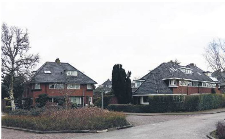
■ Het begin van de Van Heemskerklaan in Naarden.