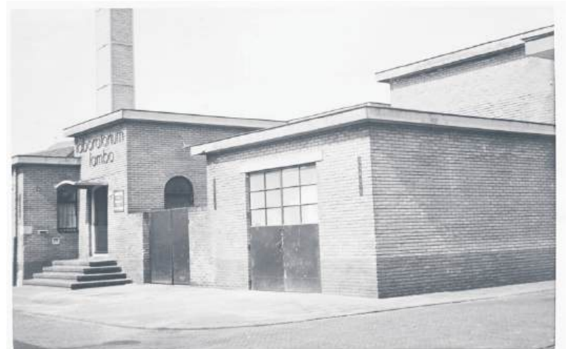
■ Laboratorium Lambo (1941).