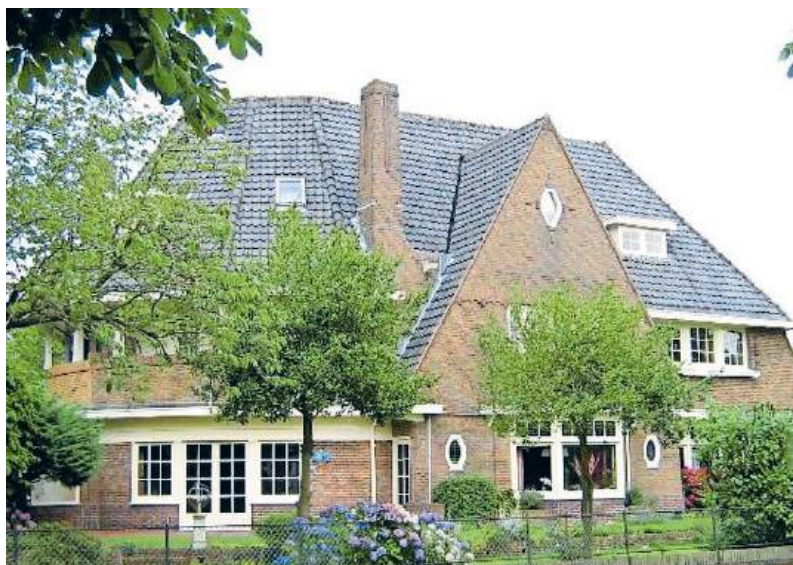
■ Dubbele villa Brediusweg 36-Bilderdijklaan 1 (1927).